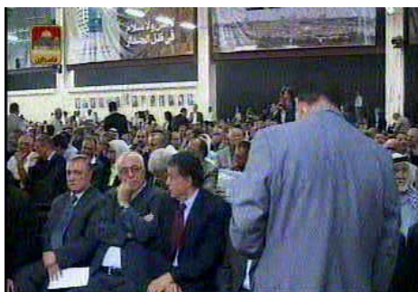
משתתפי טקס הפתיחה של ועידת פתח (טלויזיה פלסטינית, 4 באוגוסט)

■ להלן עיקרי נאום הפתיחה של אבו מאזן (גרסה ראשונית):