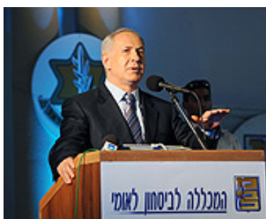
נאום ראש הממשלה בטקס סיום במכללה לביטחון לאומי (לע"מ, 28 ביולי)

■ ב-28 ביולי נאם ראש הממשלה בנימין נתניהו בטקס סיום במכללה לביטחון לאומי. בנאומו ציין, כי מדינת ישראל צריכה לתת מענה לשתי בעיות: בעיית שלילת זכות הקיום של ישראל ובעיית הביטחון שנובעת מהמימדים הגיאוגרפיים של ישראל. בהקשר לכך מנה ראש הממשלה חמישה יסודות עליהם מושתת מדיניות ממשלת ישראל בסוגיה הפלסטינית: