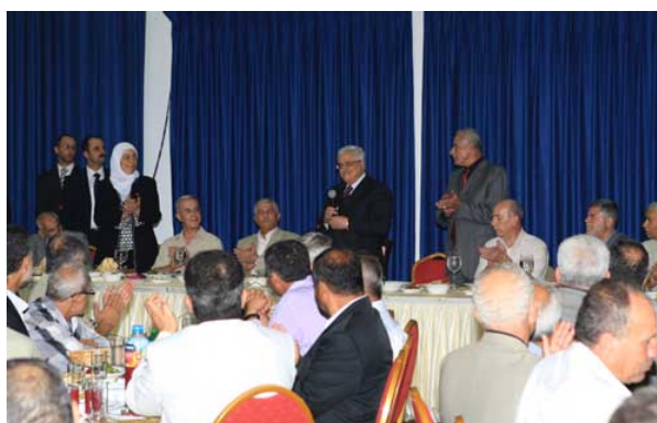
מימין: יו"ר הרשות הפלסטינית אבו מאזן מקבל את פניהן של משלחות פתח מסוריה, לבנון וירדן משמאל: צירי הוועידה מניחים זר על קברו של יאסר עראפת (ופא, 4 באוגוסט)