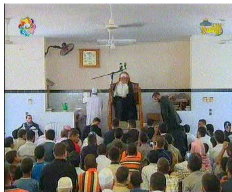
מימין: אסמאעיל הניה נושא דרשת יום שישי במסגד ברפיה (ערוץ אלאקצא, 31 ביולי) משמאל: הפגנה של חמאס ברצועת עזה במחאה על המעצרים ביהודה ושומרון (ערוץ אלאקצא, 30 ביולי)