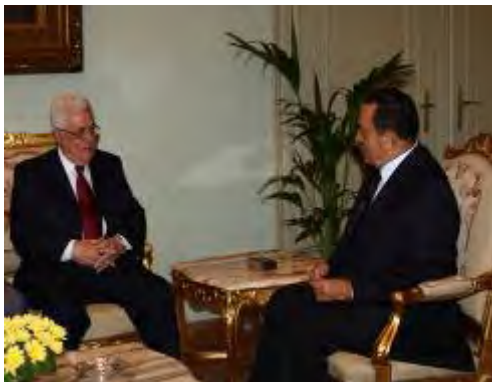
אבו מאזן נפגש עם נשיא מצריים חסני מבארכ במהלך ביקורו בקהיר ( ופא, 5 בספטמבר, 2009 )