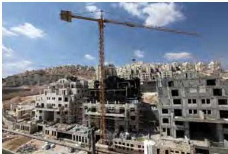
שר הביטחון אישר בנייתן של 445 יחידות דיור בהתנחלויות (8 בספטמבר)