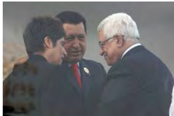
יו"ר הרשות הפלסטינית מחמוד עבאס לוחץ את ידו של נשיא וונצואלה הוגו צ'אבו במהלך ביקורו בלוב לרגל חגיגות 40 שנה לשלטון קד'אפי בלוב ( ופא 2 בספטמבר, 2009 )