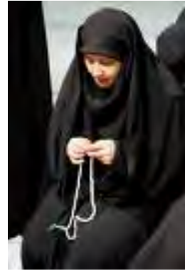
נשים וילדות עוטות גילבאב