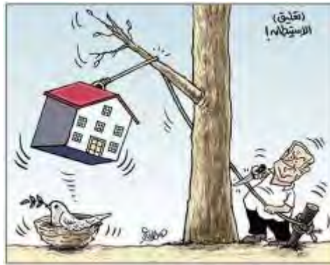
קריקטורה באתר חמאס : מימין למעלה הכיתוב: (הפסקת) ההתנחלויות (Palestine-info, 8 באוגוסט)