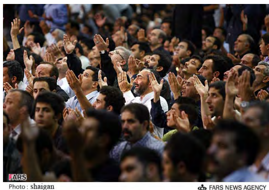
צילום מתוך טקסי סיום חודש הרמדאן בטהראן ב-2008