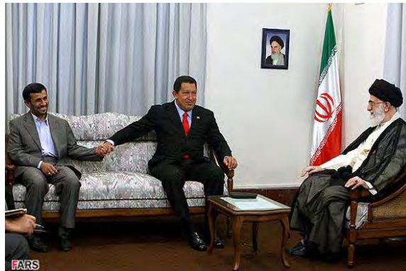
פגישת הוגו צ'אבו (במרכז) עם המנהיג חאמנהאי (מימין) ונשיא איראן אחמדינז'אד (משמאל)

ביקורו של צ'אבס באתר הקדוש לשיעים עורר ביקורת לא-מעטה באיראן, שכן הכניסה לאתר זה נחשבת אסורה עבור לא-מוסלמים. האתר החדשותי פרארו הביע במאמר שכותרתו: "האם צ'אבס הפך מוסלמי?" תמיהה, מהן אותן אמונות משותפות עמוקות לשני העמים, שאחד מהם הוא מוסלמי והשני נוצרי, ולשתי הממשלות, שאחת מהן היא אסלאמית והשנייה שמאלנית. אף על-פי שהנוצרים והמוסלמים מאמינים באותו אל, נכתב במאמר, אין בכך כדי להצדיק ביקור של נשיא קומוניסטי-נוצרי בקבר האמאם רזא. נוכחותו של צ'אבס בקבר האמאם ודבריו בנוגע להופעתו המחודשת של האמאם השנים-עשר עשויים להיחשב כשימוש בדת לצרכים פוליטיים (פרארו, 7 ספטמבר). כמה מאנשי הדת הבכירים באיראן הביעו אף הם הסתייגות מביקורו של נשיא ונצואלה באתר המקודש (מרדם סאלארי, 8 ספטמבר).