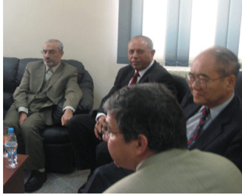
צילום שר המדע הישראלי ע'אלב מג'דלה (במרכז) לצד שר המדע האיראני זאהדי (משמאל)

בעקבות פרסום הדיווח הכחיש משרד המדעים את קיומה של פגישה בין שני השרים. בהודעה רשמית שפירסם המשרד נאמר, כי זאהדי אכן נטל חלק בכינוס בירדן, בו השתתף גם השר הישראלי, אך בין השניים לא התקיימה כל פגישה או שיחה. זאת ועוד, כאשר נודע לזאהדי, שהאדם היושב לצידו הוא שר ישראלי הוא עזב את המקום במחאה (מהר, 8 ספטמבר).