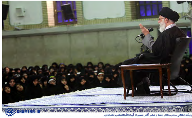
پایگاه اطلاع رسانی دفتر حفظ و نشر آثار حضرت آیت‌الله‌العظمی خامنه‌ای