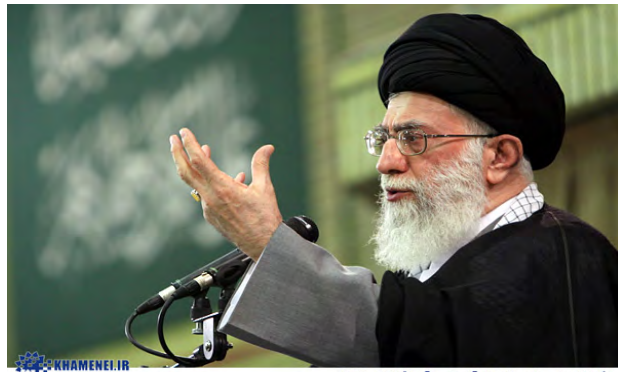
پایگاه اطلاع رسانی دفتر حفظ و نشر آثار حضرت آیت‌الله‌العظمی خامنه‌ای