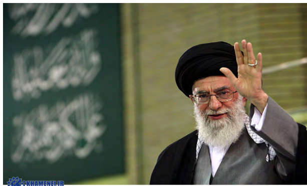
پایگاه اطلاع رسانی دفتر حفظ و نشر آثار حضرت آیت‌الله‌العظمی خامنه‌ای