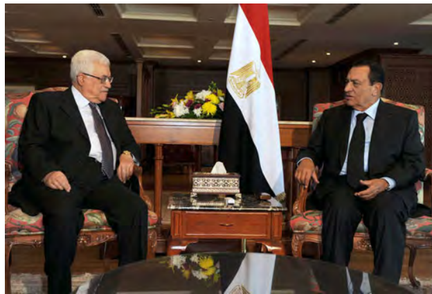
פגישת הנשיא מבראק ואבו מאזן בשרם אלשיח' (סוכנות ופא, 4 בינואר)