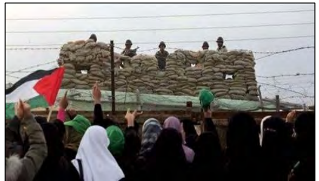
הפגנת נשים נגד המכשול המצרי סמוך למעבר רפיח (פלסטין אלן 29 בדצמבר).