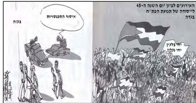
קריקטורה המביעה ביקורת על האיסור אותו הטילה חמאס על קיום מפגני תמיכה בפת"ח ברצועה (אלקדס, 3 ינואר, 2010).