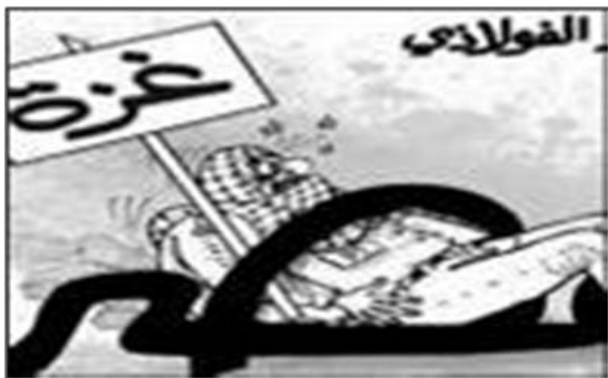
קריקטורה המבקרת את המכשול המצרי (פלסטין אלן, 4 בינואר).

■ מנגד, מצדיקים מאמרי מערכת בעיתונות הממסדית המצרית את בניית המכשול ומותחים ביקורת חריפה על חמאס ועל האחים המוסלמים במצרים על ניהול "מסע השמצה נגד מצרים בהנחיה איראנית" (אלג'מהוריה, 29 בדצמבר). לטענת מאמר מערכת אחר חמאס עושה זאת על מנת "לייצא את המשבר בו היא שרויה למצרים" (אלג'מהוריה, 4 בינואר, 2010). עוד מדגישים המאמרים כי למרות עבודות הבנייה המבוצעות בנוכחות כוחות ביטחון מצריים אין משמעותן סגירת הגבול. עורך ג'מהריה טוען כי הבנייה נועדה לחסום את הטענות שטוענת ישראל בפני ארה"ב לפיהן משמשות המנהרות להברחת אמצעי לחימה מה שעלול לגרור סנקציות אמריקאיות נגד מצרים (אלג'מהוריה, 4 בינואר, 2010).