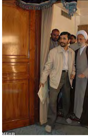
אחמדינז'אד (משמאל) עם מקור החיקוי שלו מצבאח-יזדי