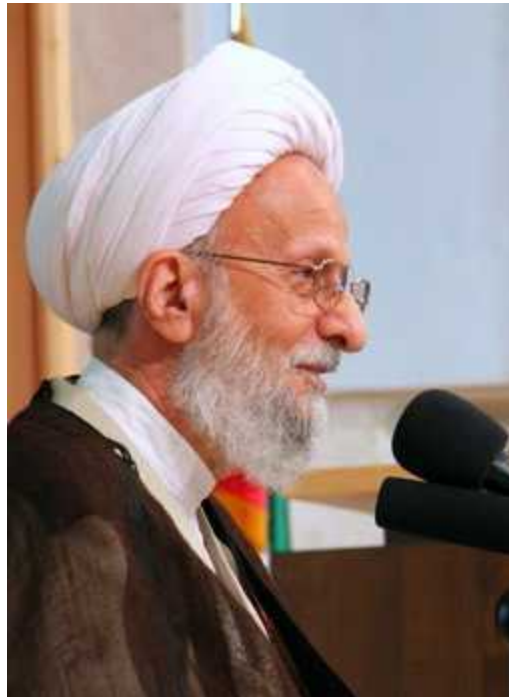
האיאתאללה מצבאח-יזדי