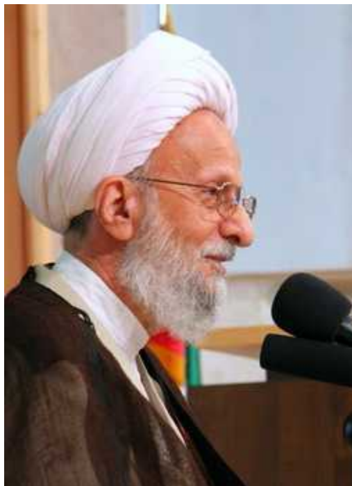
האיאתאללה מצבאח-יזדי (אתר האינטרנט של מצבאח-יזדי http://mesbahyazdi.org )

איש הדת האיראני איתאללה מצבאח-יזדי, ממקורות הסמכות הדתיים והמורה הרוחני של הנשיא אחמדי נז'אד, קבע, במשתמע, בספר הגות תיאולוגי-פוליטי, כי על איראן להשיג נשק גרעיני ("אמצעי לחימה מיוחד"). מדובר בביטוי פומבי נדיר לשיח הפנימי בקרב האליטות התיאולוגיות באיראן ובמשטר בסוגיות הגרעין