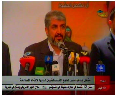
ח'אלד משעל נושא דברים בהלווייתו של אלמבחוח בדמשק (ערוץ אלאקצא, 1 בפברואר)

● בדברים שנשא ח'אלד משעל , במהלך ההלוויה שנערכה בדמשק הוא הצהיר כי חמאס מבטיחה לנקום את דמו של אלמבחוח וכי אין כל שינוי במדיניות התנועה הדבקה עדיין ב"התנגדות" כאסטרטגיה. ח'אלד משעל גם השתמש בדבריו בביטויים אנטישמיים דוגמת "הציונים רוצחי הנביאים והשליחים", "אויבי בני כל הדתות" (אלג'זירה, 29 בינואר).