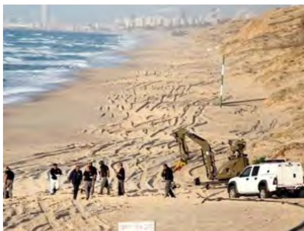
רובוט משטרתי מנטרל את חבית הנפץ בחוף אשקלון (באדיבות NRG, 1 בפברואר. צילום אדי ישראל)