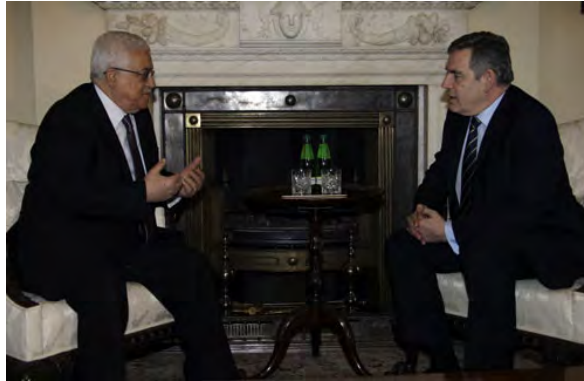
יו"ר הרשות הפלסטינית אבו מאזן נפגש עם ראש ממשלת בריטניה גורדון בראון (ופא, 29 בינואר, 2010)