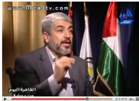
ח'אלד משעל, ראש הלשכה המדינית של חמאס מתראיין בערוץ המצרי (אליום, 26 בינואר, 2010)

● הפיוס הפנים פלסטיני - לטענתו חמאס דבקה בפיוס הלאומי ומצפה שמצרים תבחן עימה את הסיבות שגרמו לה לסרב לחתום על יזמת הפיוס המצרית. הוא שלל את טענות הרשות הפלסטינית בדבר סירובה של חמאס להגיע לפיוס והתריס: "אם חמאס מרוצה מהמצב הקיים, מדוע היא הגיעה לסבב הדיאלוג בקהיר?".