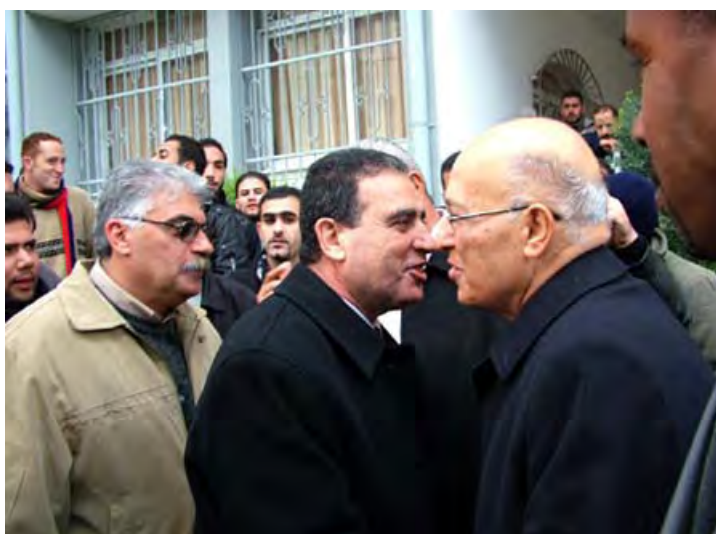
נביל שעת, בכיר פתח, בעת ביקור בביקור (חריג) בעזה (ופא, 3 בפברואר, 2010)