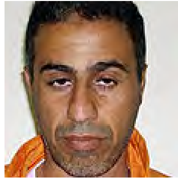
סלמן אבו עתיק