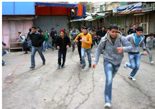
מהומות בחברון בעקבות החלטת ממשלת ישראל לכלול את מערת המכפלה ואת קבר רחל בפרויקט לשימור אתרי המורשת (ופא, 22 בפברואר, 2010)

■ כלי תקשורת ישראליים ופלסטיניים דיווחו על תהלוכות מחאה שהתקיימו בחברון ב-22 בפברואר. כמאה איש צעדו לעבר מערת המכפלה וידו אבנים על חיילי צה"ל. חייל צה"ל נפצע קל. כמו כן, הודיע הסניף המחוזי של פתח בחברון על שביתה כללית בכל המוסדות החינוכיים בעיר חברון, לרבות בתי ספר ואוניברסיטאות (ynet, nrg, מען, 21 בפברואר, 2010). הפרות סדר אירעו גם ב-23 בפברואר בשועפט במזרח ירושלים ופוזרו על ידי כוחות הביטחון הישראליים (ופא, 23 בפברואר, 2010).