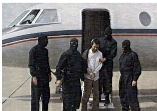
ריגי לאחר מעצרו

מיניסטריון המודיעין האיראני הודיע ביום שלישי (23 פברואר), כי כוחות הביטחון והמודיעין הצליחו ללכוד את עבד-אלמאלכ ריגי (Abdolmalek Rigi), ראש ארגון הטרור ג'נדאללה (Jondollah), במבצע במזרח המדינה.