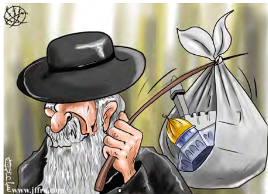
דמות היהודי הסטריאוטיפי הגזול את הר הבית, בקריקטורה, שהופיעה ביומון הרשות הפלסטינית באלחיאית אלג'דידה (3 במרץ)