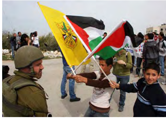
מימין: ילדים פלסטינים מניפים דגלי פלסטין ופתח בבלעין. משמאל: נשים מפגינות בשיח' ג'ראח (סוכנות ופא, 3 במרץ)

■ שיאן של ההפגנות האלימות היה בהר הבית (5 במרץ) כאשר בתום תפילת יום השישי יידו מפגינים אבנים לעבר המתפללים ברחבת הכותל המערבי (לראשונה מזה כתשע שנים) ולעבר שוטרים בשער המוגרבים. כוחות המשטרה הרחיקו את מידי האברים והשתלטו על רחבת הר הבית תוך שימוש ברימוני הלם. בתקריות נפגעו כעשרים שוטרים. לדברי מקורות פלסטינים נפצעו באירועים כשישים מפגינים.