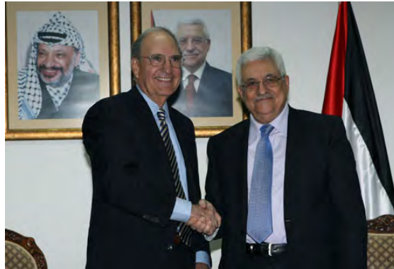
יו"ר הרשות הפלסטינית אבו מאזן עם ג'ורג' מיטשל (ופא, 23 באפריל, 2010)

התחייבויות ברורות בעניין סוגיות הליבה, ובראשן הפסקה מלאה של הבנייה בירושלים. לדבריו, הפלסטינים שואפים לחידוש המו"מ, "אולם הדבר דורש התחייבות ברורה מצד ישראל וערובות אמריקניות לכך שהמצב הנוכחי ישתנה" (הטלוויזיה הפלסטינית, 24 באפריל).