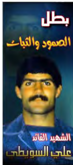
"השהיד המפקד עלי אלסויטי" פוסטר שפורסם באתר גדוד עז אלדין אלקסאם (26 באפריל, 2010)