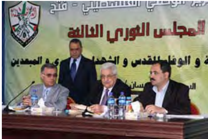
יו"ר הרשות אבו מאזן במושב הפתיחה של כינוס המועצה המהפכנית הפלסטינית (אלחיאת אלג'ידידה, 25 באפריל)