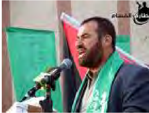
שר הפנים של ממשל חמאס פתחי חמאד

24 באפריל, 2010). בקשת המלך עבדאללה אושרה על ידי שר הביטחון אהוד ברק והרמטכ"ל רא"ל גבי אשכנזי (ynet, 24 באפריל, 2010).