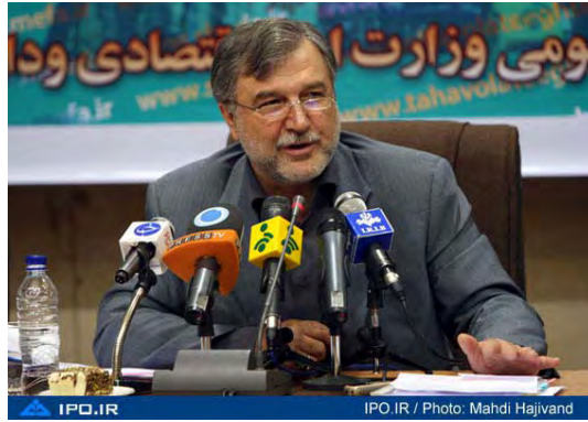
מסיבת העיתונאים של יו"ר ארגון ההפרטה האיראני, מתוך אתר הארגון

בתוך כך שבה ונמתחה השבוע ביקורת בנוגע לעיכובים ביישום מדיניות ההפרטה עליה הנחה מנהיג איראן, איתאללה עלי ח'אמנהאי, בשנת 2006. במאמר מערכת, שהתפרסם ביומון סיאסת-י רוז (Siyasat-e Rouz), נכתב, כי הפרטתן של חברות רבות מתעכבת בשל התנגדותם של כמה ממנהליהן. בין היתר ציין היומון את חברת פיתוח התעשיות הלאומיות, חברת הפלדה מבארכה (Mobarekeh), חברת בניית הספינות במפרץ הפרסי ISECO, חברת הפלדה בח'וזיסתאן וחברת הנחושת בכרמאן כחברות, שהפרטתן מתעכבת מסיבה זו (סיאסת-י רוז, 26 אפריל).