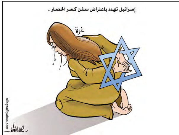
הכשרת קרקע תעמולתית למשט: "ישראל מאימת להתנגד לספינות שמתכוונות לשבור את המצור" (קריקטורה באתר המזוהה עם חמאס, פלסטין און ליין, 20 במאי, 2010)

במשט, ועליהן יהיו ראשי הועדה להסרת המצור, אנשי משפט וקבוצות של צופים. חלק מהספינות יוקצו לעיתונאים, נציגי כלי תקשורת וצלמים.