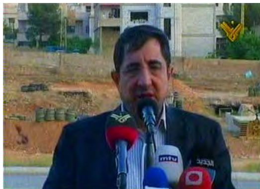
שר החקלאות בממשלת לבנון שנכח בתרגיל נוכחותו מהווה חלק מלגיטימציה לפעילות הצבאית של חזבאללה הניתנת על ידי הממשל הלבנוני. (אלמנאר, 24 במאי, 2010).