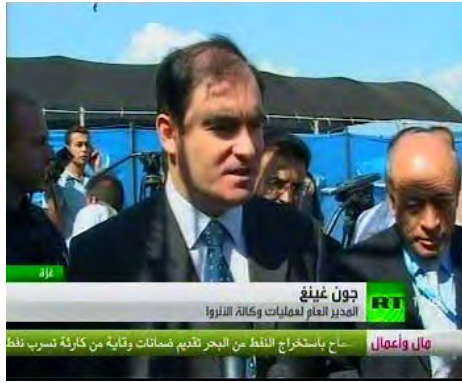
ג'ון גינג, מנהל אונר"א ברצועת עזה מגיב על שריפת מחנה הקיץ (רוסיה אליום, 23 במאי, 2010)

■ גורמי חמאס גינו את ההצתה אך ניסו להמעיט ממשמעות האירוע. משרד הפנים של ממשל חמאס הודיע כי פתח בחקירה רשמית של "שריפה חלקית של סככה של מחנה הקיץ" וכי יעשו מאמצים לאתר את העומדים מאחורי האירוע למרות שלאירוע לא היו עדי ראיה. בנוסף "יעצו" גורמים במשרד הפנים של חמאס לאונר"א לבחון את תוכניות הלימוד שלהן ולהתאימן לחברה הפלסטינית כשהם רומזים כי זו העילה לאירוע (אלרסאלה.נט, 23 במאי).