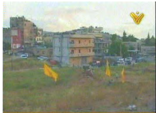
צילומים מהתרגיל שערך חזבאללה בבעלבכ (אלמנאר, 24 במאי)