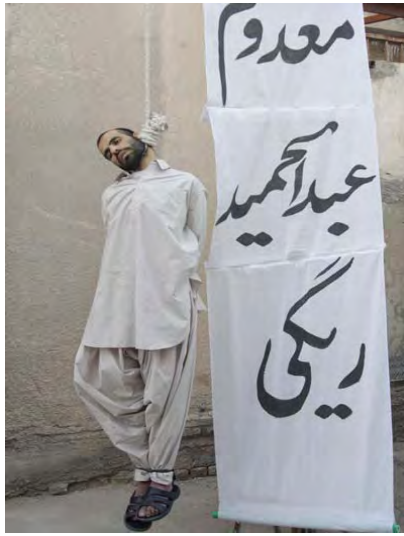
מקור התמונה: אתר החדשות האיראני, www.parsine.com , 24 מאי