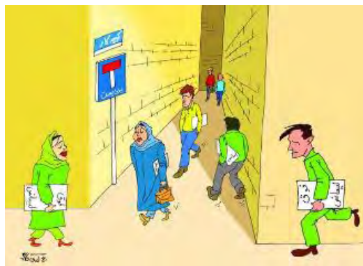
אבטלה בקרב בוגרי אוניברסיטאות, מרדם סאלארי, 15 מאי

היומון מרדם סאלארי התייחס אף הוא למשבר האבטלה בקרב צעירים משכילים. במאמר פרשנות, שפרסם היומון בשבוע שעבר (מרדם סאלארי, 15 מאי), נכתב, כי אם בעבר נחשבה השכלה אקדמית באוניברסיטה מספקת לצורך מציאת עבודה, הרי שכיום מוצאים עצמם יותר ויותר צעירים בוגרי אוניברסיטאות ללא עבודה. היומון דיווח, כי יותר מ-350 אלף סטודנטים מסיימים מדי שנה את לימודיהם וכי למעלה ממחציתם אינם מצליחים למצוא עבודה במקצוע אותו רכשו.