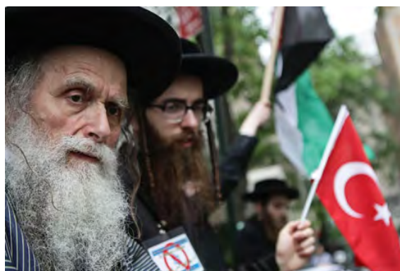
הפגנה מול הבית הלבן ובניו יורק (Today's Zaman, 3 ביוני 2010)

● בברלין התקיימה הפגנה בה השתתפו מאות פלסטינים, ערבים וגרמנים פרו-פלסטיניים. כמו כן התקיימו ברחבי גרמניה הפגנות נוספות (אלג'זירה, 31 במאי 2010, IRNA, 5 ביוני 2010).