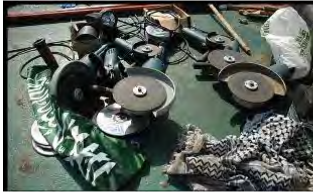
דיסקים ששימשו לניסור המעקים ושרשראות הברזל

■ נוסעי הספינה העידו על קשרים הדוקים שמקיים הארגון עם ראש ממשלת תורכיה טאיפ ארדואן, ועל מעורבות הממשל התורכי בהכנות למשט. העדויות הללו מחזקות את הרושם הראשוני, כי מטרת המשט לא הצטמצמה לשיגור סיוע הומניטרי לתושבי רצועת עזה, אלא התמקדה בייצור פרובוקציה ועימות אלים עם ישראל.