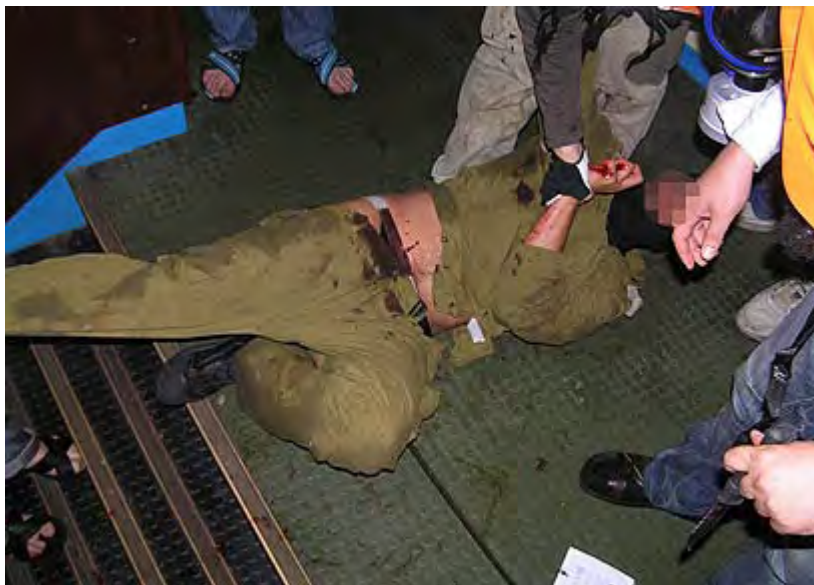
פעילי IHH תוקפים חייל צה"ל באמצעות נשק קר, שהוכן על ידם מבעוד מועד (hurriyet, 6 ביוני, 2010)