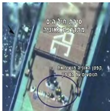
השתלטות חיל הים על האונייה, וכניסת הספינה "רייז'ל קורי" לנמל אשדוד (אתר דובר צה"ל, 5 ביוני 2010)