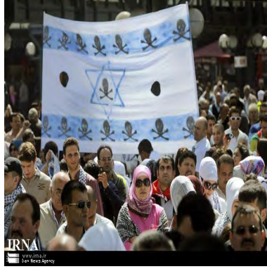
הפגנה בברלין ב-5 ביוני (IRNA, 5 ביוני 2010)