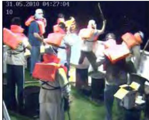
תמונה של מצלמות האבטחה של הספינה Mavi Marmara המתעדות את היערכות פעילי IHH לתקיפת צה"ל (דובר צה"ל, 3 ביוני, 2010)

■ ניתוח ראשוני של עדויות שנגבו מנוסעי הספינה התורכית Mavi Marmara, לאחר שהובלו לנמל אשדוד, מצביעות על כך שפעילי IHH, ארגון תורכי בעל אופי אסלאמי-רדיקלי 3 , הם אלו שהובילו את העימות האלים נגד חיילי צה"ל על גבי סיפון הספינה.