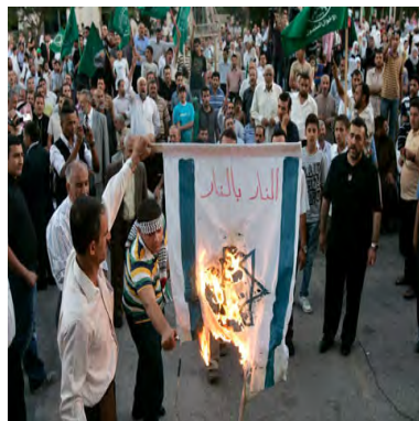
הפגנה בעמאן, ירדן ב-31 במאי (Today's Zaman, 3 ביוני)