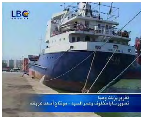
הספינה ג'וליה עוגנת בנמל טריפולי (LBC, 29 ביוני 2010)