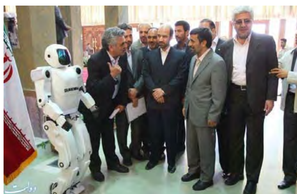
מתוך אתר דובר הממשלה: http://www.dolat.ir/NSite/FullStory/?id=190568

איראן חשפה השבוע את הרובוט סורנא-2 (Suren-2), רובוט אנושי השוקל 45 ק"ג וגובהו 145 ס"מ. הוא פותח על-ידי קבוצה של למעלה מ-20 מומחים לרובוטיקה באוניברסיטת טהראן, שעדיין מפתחים מערכות ראייה ושמיעה עבור הרובוט. התקשורת האיראנית דיווחה, כי רובוטים מעין זה נועדו לשמש ב"משימות רגישות וקשות", אך לא מסרה לאיזה צורך ספציפי פותח הרובוט ולא פירטה בנוגע ליכולותיו.