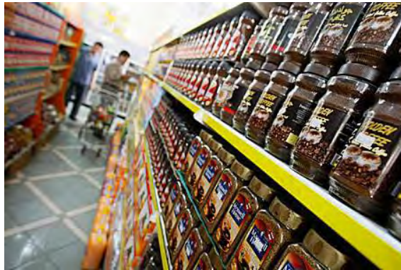
מרכול ברצועת עזה (אתר חדשות מ-מאע"מ, 8 ביולי 2010)

■ גורמים במגזר הפרטי ברצועת עזה הביעו חשש שמדיניות ההקלות תביא לתחרות עם סחורות, שמקורן בישראל, והם קוראים להגביל כניסת סחורות מישראל. כך למשל נטען במגזר תעשיות העץ כי יש להגביל את כניסת הרהיטים לרצועה. גם בעלי מפעלי המשקאות הקלים ברצועת עזה הביעו חשש מפני הפסקת פעילות מפעליהם עקב מדיניות ההקלות הישראלית החדשה המתירה הכנסת משקאות קלים. הם טענו כי ביכולתם לספק את צרכי השוק המקומי אך לא יוכלו להתחרות עם מחירי הסחורות מישראל, וקראו לממשל חמאס למנוע את הכנסת המשקאות הקלים מישראל (פלסטיין, 4 ביולי 2010).