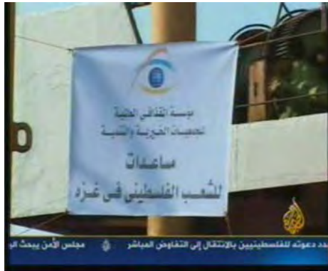
סמל הקרן הלובית על גבי הספינה (אלג'זירה, 11 ביולי, 2010)

■ ב-11 ביולי בסביבות השעה 1900 יצאה מנמל Lavrio שביוון (כ-50 ק"מ מאתונה) הספינה Amalthea ששמה שונה לאמל/HOPE (תקווה), בדרכה לעבר רצועת עזה. את השיט מארגן ארגון צדקה לובי המכונה "קרן קד'אפי הבינלאומית לצדקה ולפיתוח" המנוהל על ידי סוף אלאסלאם קד'אפי, בנו של מנהיג לוב מעמר קד'אפי 2 . בשעות הערב המאוחרות של ה-13 ביולי נעצרה הספינה, לטענת הקברניט עקב תקלה טכנית, אף שייטכן וברקע מחלוקת על הסיפון לגבי יעדה של הספינה או ניסיון "למשוך זמן". בבוקר 14 ביולי המשיכה הספינה בדרכה.