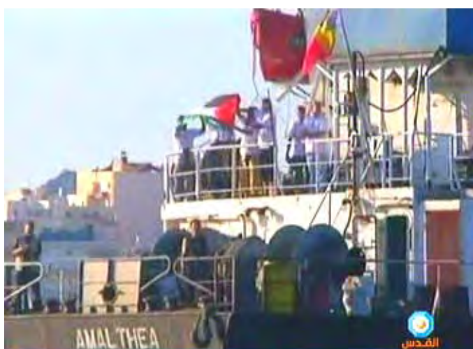
הספינה אמלתיאה (אמל) יוצאת לדרכה (ערוץ אלקדס, 11 ביולי 2010)