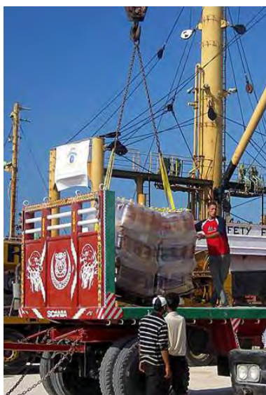
הספינה אמלתיאה (אמל) פורקת את הציוד בנמל אלעריש