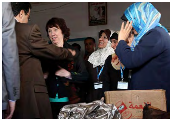
קת'רין אשטון בעת ביקור בעזה (19 ביולי 2010, sdapem.wordpress.com)

■ קת'רין אשטון, שרת החוץ של האיחוד האירופי החלה ב-19 ביולי ביקור בן שלושה ימים במזרח התיכון, במסגרתו נפגשה עם ראש הממשלה בנימין נתניהו, שר החוץ אביגדור ליברמן ועם מתאם הפעולות בשטחים. כמו כן נפגשה אשטון עם סלאם פיאצ', ראש ממשלת הרשות הפלסטינית. כן ערכה ביקור ברצועת עזה (מבלי להיפגש עם נציגי ממשל חמאס) ובמזרח ירושלים. במהלך ביקורה קראה אשטון לשחרור החייל החטוף גלעד שליט וקראה לאפשר לצלב האדום לבקר. אשטון הביעה התנגדותה לשליחת משטים נוספים לרצועת עזה וקראה לפתיחת המעברים בטענה ש"המצור" על רצועת עזה "בלתי מתקבל על הדעת ואינו מועיל. היא גם הביעה תמיכה בהקמת המדינה הפלסטינית והדגישה שעמדת האיחוד האירופי הינה כי עזה הינה חלק מהמדינה הפלסטינית (RTTNEWS, 19 ביולי 2010; ופא, 18 ביולי 2010; אתר מועצת האיחוד האירופי, 18 ביולי 2010).