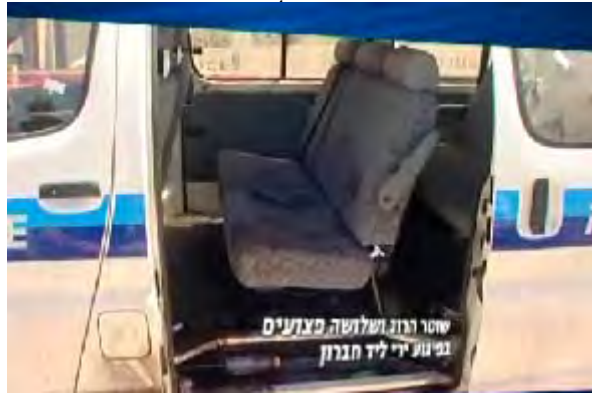
הניידת הפגועה ליד חברון לאחר הפיגוע בו נהרג שוטר משטרת ישראל (באדיבות ערוץ 10 14 ביוני)

■ מחקירתם עולה כי תכננו לבצע פיגועים נוספים כולל פיגוע חטיפה של חייל או אזרח באזור גוש עציון . לשם כך ערכו סיורים מקדימים באזור ואף רכשו כיפות ופאה נוכרית (אתר שירות ביטחון כללי, 19 ביולי 2010).