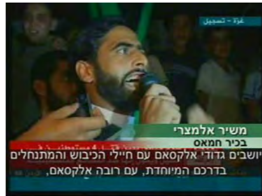
משיר אלמצרי מברך על הפיגוע, בו נהרגו ארבעה אזרחים ישראליים (אלג'זירה, 31 באוגוסט 2010)

■ גם בחזבאללה הובעה תמיכה בפיגוע. בהודעה רשמית שפרסם הארגון נאמר, כי מדובר ב"מסר ברור המוכיח כי אין שום אופציה אחרת זולת ההתנגדות". לטענתם מדובר בתגובה ל"מדיניות הכיבוש וההתנחלויות" וכי "ניתן לראות במתנחלים חיילי כיבוש גם אם הם לא לובשים מדים צבאיים" (אלאנתקאד, 2 בספטמבר 2010).