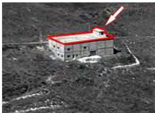
המבנה בפאתי הכפר ח'רבת סלם, ששימש מחסן נשק של חזבאללה. בצילום נראה המבנה לפני הפיצוץ (מימין) ולאחריו (משמאל).

● ב-12 באוקטובר 2009 בשעה 21:15 אירע פיצוץ בביתו של פעיל חזבאללה בכפר טיר פלסיה , (כ-15 ק"מ צפונית מזרחית לעיר צור, מדרום לנהר הליטאני). כתוצאה מהפיצוץ בבית, ששימש כמחסן אמצעי לחימה, נפגעו ככל הנראה כמה בני אדם כולל בעל הבית. קיימות דיעות סותרות אודות מספר הנפגעים: חזבאללה וצבא לבנון טוענים כי רק אדם אחד נפצע. כלי התקשורת האחרים דיווחו על חמישה הרוגים (רויטרס, 12 באוקטובר), שני הרוגים (אלערביה, 12 באוקטובר) או הרוג אחד (אי.פי, 12 באוקטובר).