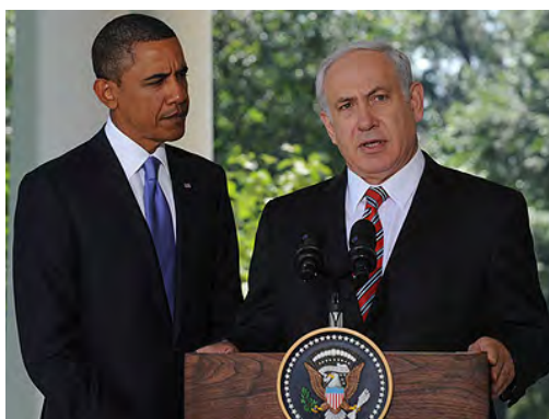
ראש ממשלת ישראל נתניהו והנשיא אובאמה לפני ארוחת ערב עבודה

■ בנאום שנשא בנימין נתניהו, ראש ממשלת ישראל, אמר כי הוא רואה באבו מאזן "שותף לשלום" . הוא הדגיש כי "שלום אמיתי יושג רק בויתורים הדדיים וכואבים משני הצדדים" וכי "העם בישראל ואני כראש ממשלתו...מוכנים לעבור מרחק רב בזמן קצר כדי להשיג שלום אמיתי". נתניהו אמר כי עמודי התווך לשלום הינם הכרה של הפלסטינים בישראל כמדינת העם היהודי וסידורי בטחון נגד ה"כוחות החדשים" שעלו באזור, בדגש על "איראן ושליחיה ו[על] לוחמת הטילים" (אתר משרד ראש הממשלה, 2 בספטמבר 2010; הארץ, 3 בספטמבר 2010).