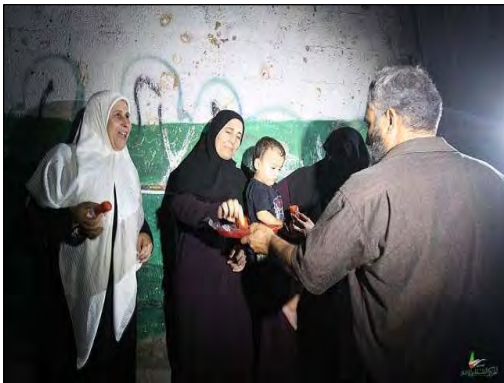
חלוקת ממתקים במסגרת חגיגת שמחה במחנה הפליטים ג'באליא, לאחר הפיגוע בו נהרגו ארבעה אזרחים ישראליים (Palestine-info, 31 באוגוסט 2010).