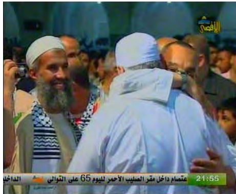
קבלת פנים למשלחת מאלג'יריה לרצועת עזה (ערוץ אלאקצא, 4 בספטמבר 2010)

● אלג'יריה: משלחת סיוע מאלג'יריה נכנסה לרצועת עזה ב-4 בספטמבר והתקבלה על ידי אסמאעיל הניה, ראש ממשל חמאס ושרים נוספים. המשלחת הביאה עימה לרצועה 2,500 טונות של מזון ושל סיוע אחר כגון כסאות גלגלים, חיתולים וציוד לבתי הספר. כמו כן הביאו עימם סכום כסף המיועד לבניית בית חולים (מען, 4 בספטמבר 2010; אליום אלסאבע, 2 בספטמבר 2010).