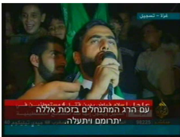
משיר אלמצרי, דובר חמאס, מברך על פיגוע הירי ביהודה ושומרון (אלג'זירה, 31 באוגוסט 2010)