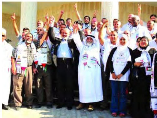
חברי המשלחת התורכית עם אסמאעיל הניה

● תורכיה: ב-13 באוגוסט הגיעה לעזה משלחת תורכית המונה 45 בני אדם, ובה גם תשעה פעילי IHH שנפצעו בעימות על גבי מאוי מרמרה. המשלחת התקבלה בידי ראש ממשל חמאס אסמאעיל הניה, שרים וחברי פרלמנט.