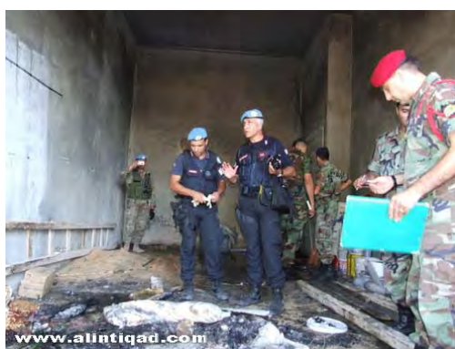
כוחות יוניפי"ל בוחנים את מקום הפיצוץ מבפנים ומבחוץ