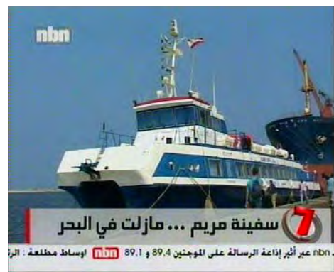
הספינה "מרים" בנמל טריפולי (מימין) וסמל הספינה (משמאל) (NBN 4 בספטמבר 2010)

■ בריטניה: שיירת הסיוע "עורק חיים 5", אותה מארגן ארגון Viva Palestina של חבר הפרלמנט הבריטי לשעבר, הפרו-חמאסי, ג'ורג' גאלווי, יחד עם "הוועדה הבין לאומית להסרת המצור מעל עזה" צפויה לצאת לדרכה מלונדון ב-18 בספטמבר 2010. זאהר ביראוי , פעיל חמאס אשר מצא