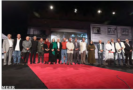
פסטיבל הקולנוע השנתי ב"בית הקולנוע" בטהראן, 16 ספטמבר

משרד ההכוונה לא הסתפק בדברי השר ובשבוע שעבר הודיע סגנו לענייני קולנוע, ג'ואד שמקדרי (Javad Shamaqdari), כי המשרד החליט לשלול מפרהאדי את הרישיון להפקת סרטו החדש. שמקדרי מתח ביקורת חריפה על דברי פרהאדי ואמר, כי הוא מבקש להתנצל בפני משפחות החללים, ששפכו את דמם למען המהפכה האסלאמית, על האופן שבו התנהל פסטיבל הקולנוע השנתי (איסנ"א, 2 אוקטובר).