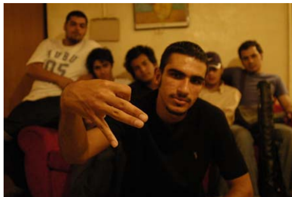
ראפרים איראנים

מוסיקת ראפ מקורית בשפה הפרסית הפכה בשנים האחרונות פופולארית בקרב צעירים איראנים. תכני המוסיקה עוסקים, בין היתר, בפוליטיקה, בחברה ואף במין. מספר שירים, שהוקלטו על-ידי זמרי ראפ אושרו להפצה על-ידי משרד ההכוונה האסלאמית, אך רוב המוסיקה מסוג זה מופצת באמצעות השוק השחור והאינטרנט. בשנים האחרונות הגבירו שלטונות איראן את המאבק נגד סוג זה של מוסיקה. בין היתר סגרו הרשויות אולפנים, ששימשו להקלטות מוסיקת "ראפ", וכוחות ביטחון הפנים פשטו על הופעות מחתרטיות בהן הופיעו זמרי ראפ. שר ההכוונה האסלאמית בממשלתו הראשונה של הנשיא אחמדינז'אד, מחמד חסין צפאר-הרנדי (Mohammad Hossein Saffar Harandi), הכריז בראשית תפקידו, כי בכוונתו לטפל בסוגי מוסיקה הסותרים לדבריו את ערכי הרפובליקה האסלאמית, ובכללם רוק וראפ. הוא קרא למוסיקאים באיראן ליצור מוסיקה בעלת משמעות.