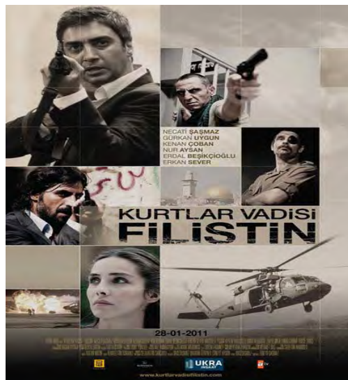
אחת הכרזות שפורסמה לקראת עליית הסרט לאקרנים בו נראית דמותו של הגיבור הראשי כשהיא מכוונת רובה (למעלה משמאל)

א. הופצה סדרת כרזות המפרסמות את הסרט. בכרזות ניתן לראות יד מחזיקה אבנים, אנשים אוחזים ברובים או את גיבור הסרט המשחק את דמותו של הסוכן התורכי כשהוא מכון את נשקו.