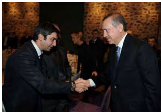
השחקן הראשי פולאט מדאר לוחץ את ידו של נשיא תורכיה ארדואן (אלצבאח, 16 בינואר 2011)

ג. בראיון שנערך עם השחקן הראשי של הסרט, פולאט אלמדאר, המגלם את דמותו של הסוכן, אמר השחקן כי ההחלטה להפיק סרט, שעלילתו מרחשת בפלסטין, עלתה עוד במהלך הפקת הסרט אודות עיראק. 1 לאחר אירועי ה"מרמרה" שונה התסריט, שכבר היה בשלבי הכנה (אלסבאח, 16 בינואר 2011).