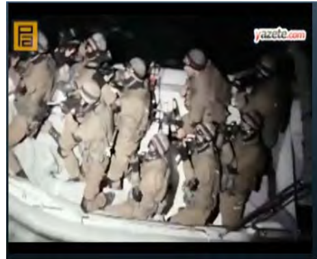
מתוך הקדימונים לסרט: מימין: חיילי קומנדו ישראליים לקראת העלייה על ה"מאוי מרמרה". משמאל: טנק ישראלי (בעזה?)

ג. בראיון שנערך עם השחקן הראשי של הסרט, פולאט אלמדאר, המגלם את דמותו של הסוכן, אמר השחקן כי ההחלטה להפיק סרט, שעלילתו מרחשת בפלסטין, עלתה עוד במהלך הפקת הסרט אודות עיראק. 1 לאחר אירועי ה"מרמרה" שונה התסריט, שכבר היה בשלבי הכנה (אלסבאח, 16 בינואר 2011).