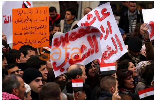
הפגנת תמיכה בעם המצרי בעיר ראמאללה (צפא, 5 בפברואר 2011)