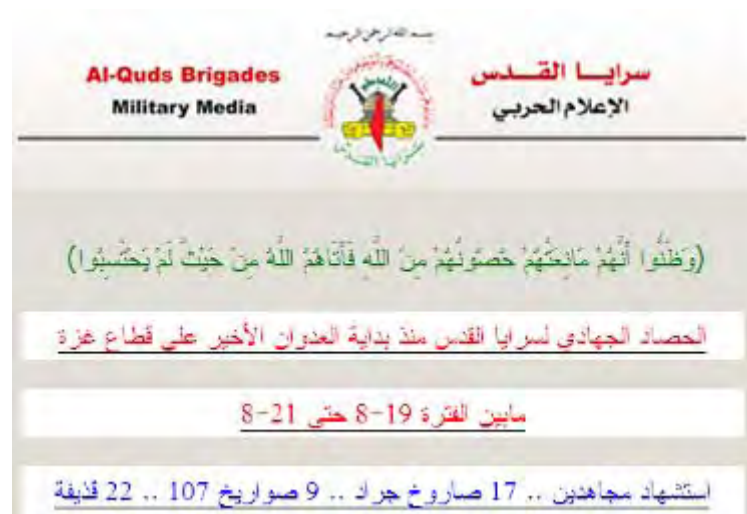
הודעת הג'יהאד האסלאמי בפלסטין על ירי הרקטות לעבר ישראל בין ה-19 ל-21 באוגוסט (אתר פלוגות ירושלים)

5. הג'יהאד האסלאמי בפלסטין פרסם הודעה המפרטת את מקרי הירי בהם היה מעורב ארגונו בין ה-19 ל-21 בספטמבר. על פי ההודעה שיגר הארגון 17 רקטות גראד , 9 רקטות 107 מ"מ , 3 רקטות (מתוצרת עצמית) "קדס" ו-22 פצצות מרגמה (אתר פלוגות ירושלים, 23 באוגוסט). הפלג המרכזי בארגון ועדות ההתנגדות העממית ("חטיבות צלאח אלדין") דיווח כי אנשיו שיגרו באירועים האחרונים עשרות רקטות לעבר דרום ישראל . מנטילות האחריות עולה כי שני הארגונים הללו מילאו תפקיד מרכזי בירי הרקטות לעבר ישראל בסבב ההסלמה האחרון (סה"כ נורו במהלך ההסלמה כ-160 רקטות לעבר ישראל, ומהם כ-120 נפלו בשטחה).