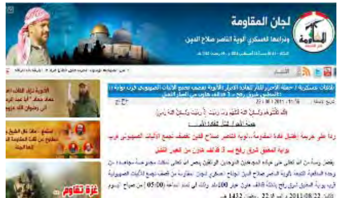
מתוך נטילת אחריות של "ועדות ההתנגדות העממית" על ירי רקטה (נאצר 3") לעבר הגנג המערבי (ב-22 באוגוסט, 05:00) (qaweim.com)