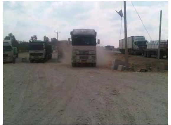
משאיות סיוע נכנסות לרצועה במהלך ההסלמה האחרונה (מתאם פעולות הממשלה בשטחים, 23 באוגוסט 2011)

7. בנוסף לכך עברו לישראל מהרצועה מעל למאה חולים פלסטינים לקבלת טיפול רפואי ועשרות מתנדבים זרים , שהורשו להיכנס לרצועת עזה (מתאם פעולות הממשלה בשטחים ואתר דובר צה"ל, 23 באוגוסט 2011).