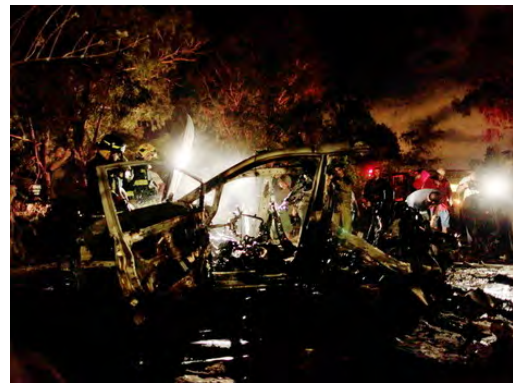
מימין: כלי רכב שנפגע מירי רקטה ונשרף כליל. משמאל: תינוק מאשקלון שנפצע באורח קל מנפילת רקטה בקרבתו (25 באוגוסט 2011).

5. מספר ארגוני טרור הפועלים ברצועה נטלו אחריות על ירי הרקטות בתוכם בלט הג'האד האסלאמי בפלסטין. באתר הארגון פורסם כי הוא ירה בליל ה-24 באוגוסט רקטות גראד לעבר באר שבע, אשקלון, אופקים והמועצה האיזורית אשכול. על פי התקשורת המצרית אחת הרקטות שנורתה מעזה נפלה בכיכר נפורה, שברפיח המצרית. כתוצאה מכך נפגעה אישה.