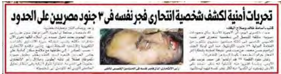
צילום המחבל המתאבד

14. העיתון "אלמצרי אליום" (22 באוגוסט) מסר כי מחבל מתאבד, שהתפוצץ בקרבת חיילים מצריים במהלך ההתקפה, הינו אלמוני שעל פי תווי פניו אינו נראה מצרי . על פי העיתון נערכות בדיקות ד.נ.א במטרה לקבוע זהותו. העיתון פרסם את תמונת ראשו של המחבל.