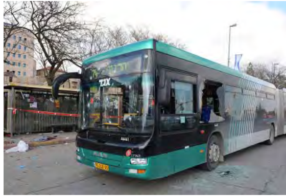
פיגוע הטרור שאירע בתחנת אוטובוס בירושלים סמוך לבנייני האומה ב-23 במרץ. בפיגוע נהרגה אישה אחת (אזרחית בריטית) ונפצעו 47 אזרחים ישראלים (, 24 במרץ 2011)