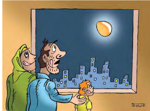
מתוך: היומון מרדם סאלארי (Mardom Salari), 9 אוקטובר

האתר "פרארו" (Fararu) טען השבוע בסרקזם, כי מחירי הביצים האמירו עד כדי כך, שבקרוב יחלו אזרחי מחוז גולסתאן שבצפון-מזרח המדינה להעניק ביצים כנדוניה עבור נשים לקראת חתונתן (פרארו, 9 אוקטובר). היומון הרפורמיסטי "שרק" (Sharq) ציטט נהג מונית בן 70, שטען בייאוש, כי הביצים הפכו לזהב וכי בקרוב יגיע היום בו יראו האזרחים לילדיהם ביצים רק בתמונות, כיוון שהן יהיו יקרות מכדי לקנות אותן (שרק, 9 אוקטובר).