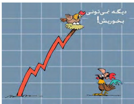
"אינך יכול עוד לאכול אותן", מתוך: רוז אונליין, 9 אוקטובר

על משרד המסחר את האחריות לפער הגדול בין מחיר הביצים הנמכרות על-ידי היצרנים למחירים בחנויות (תאבנאכ, 8 אוקטובר).