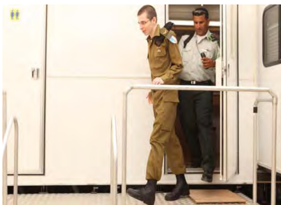
גלעד שליט לבוש במדי צה"ל לאחר שהגיע לבסיס צה"ל סמוך למעבר כרם שלום (אתר דובר צה"ל, 18 באוקטובר)