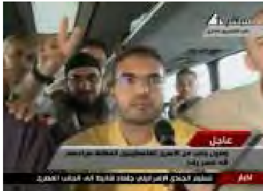
מחבלים מרואיינים ע"י הטלוויזיה המצרית בדרכם לרצועת עזה (הטלוויזיה המצרית, 18 באוקטובר)

6. אבו עבידה , דובר הזרוע הצבאית של חמאס הצהיר כי חמאס לא תשקוט עד אשר ירוקנו את בתי הכלא של ישראל .