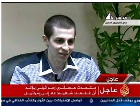
גלעד שליט מתראיין בטלוויזיה המצרית לאחר החזרתו (הטלוויזיה המצרית, 18 באוקטובר). בראיון מסר כי הוא מתגעגע למשפחתו ולחברים ותמיד האמין שישוחרר