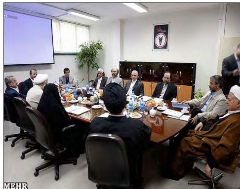
ישיבת הוועד המנהל של אוניברסיטת אזאד

דאנשג'ו עצמו אמר במסיבת העיתונאים, כי רק ארבעה מבין תשעת חברי הנהלת האוניברסיטה התנגדו לקיום הצבעה במהלך הישיבה האחרונה ודרשו לדחות את ההצבעה עד שכלל המועמדים יגישו את תוכניותיהם לניהול האוניברסיטה באופן אישי. הוא אמר, כי טרם ההצבעה אמר לו רפסנג'אני, כי אינו מתנגד למועמדותו. הוא קרא לחברי ההנהלה לקבל את דעת הרוב והגדיר את ההודעה, שהתפרסמה מטעם רפסנג'אני, כהחלטה המשקפת את דעת המיעוט (פארס, 11 ינואר 2012).