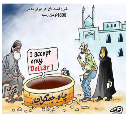
חלפן כספים בבאר ג'מכראן (ממנה אמור לשוב על-פי האמונה השיעית האמאם הנעלם), מתוך: http://pejwake-hambastegi.blogspot.com , 23 ינואר 2012

היומון הכלכלי דניא-י אקתצאד (Donya-ye Eqtesad) דיווח השבוע על ביקורת גם מצד בכירים במגזר הפרטי כלפי מדיניות הבנק המרכזי והממשלה, שהובילה, לדבריהם, לזינוק בשער הדולר בשבועות האחרונים. בראיונות, שהעניקו ליומון, טענו בכירים בלשכת המסחר האיראנית, כי הצעדים בהם נקטו השלטונות עד כה, ובהם פעילות נגד סוחרי המט"ח, אינם יעילים וכי יש צורך בשינוי המדיניות המקרו-כלכלית. בכירים אלה הגדירו את מדיניות הבנק המרכזי לנוכח ההתפתחויות בשוק המט"ח כ"פסיבית ותגובתית" וטענו, כי הבנק המרכזי היה חייב להעלות כבר לפני מספר חודשים את שער הדולר היציג על מנת למנוע פער כה גדול בין שער היציג לבין שער השוק החופשי (דניא-י אקתצאד, 21 ינואר 2012).