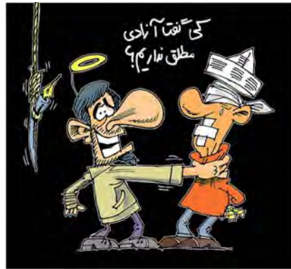
"מי אמר שאין לנו חופש מוחלט?", מתוך: רוז אונליין, 16 ספטמבר 2010.