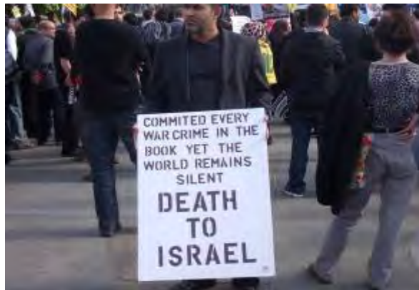
כרזה הקוראת "מוות לישראל" בעצרת לרגל "יום ירושלים" בכיכר טרפלגר בלונדון ב-21 באוגוסט 2011