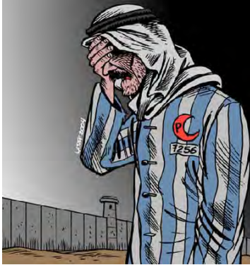
דמותו של הפלסטיני כאסיר מחנות ההשמדה (המחליפה את דמות היהודי אסיר המחנות). הקריקטוריסט הינו קרלוס לטיף, ברזילאי, בעל בלוג אנטישמי.

המתייחסות להכחשת השואה. כך למשל, ב-14 באוגוסט 2006, חודשים ספורים לפני שנערך כנס הכחשת השואה באיראן, התקיימה תחרות קריקטורות בינלאומיות בנוגע להכחשת השואה. התחרות אורגנה באמצעות האתר האיראני Ircartoon.com , היוזם עתה את תחרות התמיכה ב-GMJ. להלן דוגמאות לקריקטורות שזכו ב-2006 בתחרות: