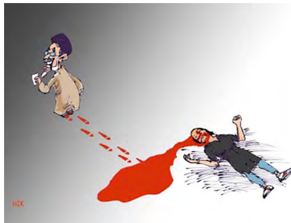
קריקטורה של ניק אהנג כות'ר (Nik Ahang Kowsar) ( www.khodnevis.org , 3 מרץ 2012)

השתתפות ח'אתמי בבחירות עוררה תגובות זעם בקרב גולשים איראנים ברשתות החברתיות, שהאשימו את הנשיא לשעבר בבגידה.