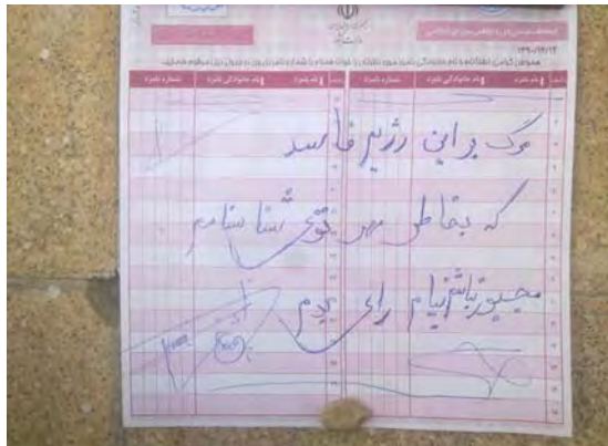
פתק הצבעה ועליו נכתב: "מוות למשטר המושחת, שמאלץ אותי להצביע בעבור חותמת בתעודת הזהות (דף פייסבוק של גולשת איראנית).

בעלי זכות הבחירה במחוז נמוך ב-2.5 מיליון ממספר בעלי זכות הבחירה בבחירות לנשיאות בשנת 2009, כפי שנמסר על-ידי משרד הפנים. מאחר שלא סביר שאזרחים כה רבים עזבו את המחוז או נפטרו מאז בחירות 2009, על מושל המחוז להתייחס לפער בנתונים בנוגע לבעלי זכות הבחירה בין שנת 2009 לשנת 2012 (באזתאב, 3 מרץ 2012).