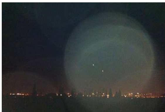
מערכת כיפת ברזל בפעולה בשמי הדרום (דובר צה"ל 11 במרץ 2012)