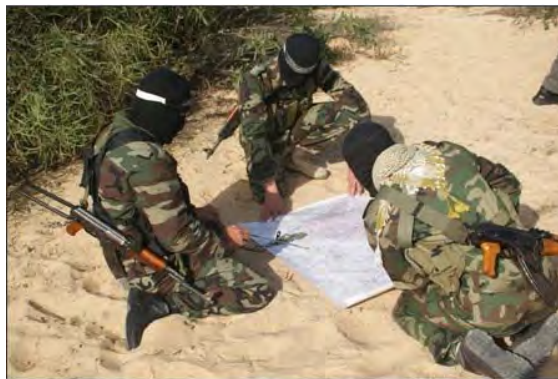
פעילי טרור של וועדות ההתנגדות העממית (אתר הארגון 12 במרץ 2012)