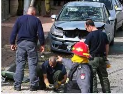
כוחות כיבוי ומשטרה בודקים רקטה שנפלה בבאר שבע

5. בסבב ההסלמה, שעדיין לא הסתיים, מבוצע ירי רקטות בהיקף גדול יותר מסבבים הקודמים. סה"כ נורו עד כה כמאתיים רקטות לעבר ישראל. קרוב למאה רקטות נפלו בשטח ישראל. כמה עשרות רקטות נוספות יורטו על ידי מערכת כיפת ברזל. רוב הרקטות, שנורו לטווחים ארוכים (סביב 40 ק"מ), הינן רקטות 122 מ"מ (גראד משופר).