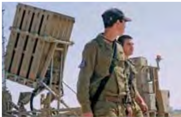
מימין: מערכת כיפת ברזל (דובר צה"ל 12 במרץ 2012). משמאל: מפקד חיל האוויר נפגש עם לוחמי סוללת כיפת הברזל (דובר צה"ל 11 במרץ 2012)