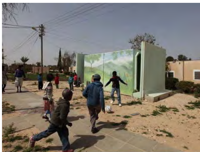
ילדים רצים למיגונית בעת אזעקה בבאר שבע (באדיבות NRG, 12 במרץ 2012. צלם: יהודה לחיאני)