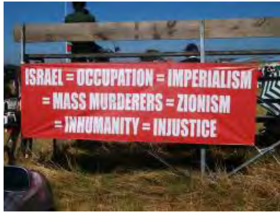
פוסטר אנטי ישראלי שהופיע ב-2011 באתר האינטרנט של MJC.