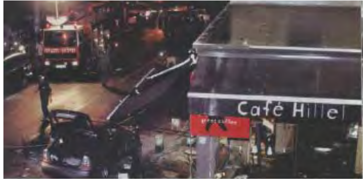
זירת הפיגוע (פלסטיין אלמסלמה, אוקטובר 2003)

6. הפיגוע בקפה הלל בוצע ב-9 בספטמבר 2003 ע"י תשתית חמאס במזרח ירושלים בהפעלת מפקדת חמאס בראמאללה. מבצע הפיגוע היה מחבל מתאבד מהכפר רנתיס בשם ראמזי פהמי עז אלדין אבן סלים, שפוצץ עצמו בפתח בית הקפה. כתוצאה מהפיגוע נהרגו שבעה בני אדם וקרוב ל-70 נפצעו (פרטים על הנרצחים ראו נספח ב').