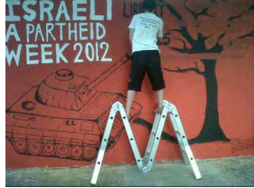
אירועי "שבוע האפרטהייד" בדרום אפריקה