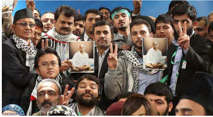
פעילי השיירה האסיאתית בצילום משותף עם נשיא איראן תוך שימוש בדמות של גנדי (19 במרץ 2012 http://proisraelbaybloggers.blogspot.com )

■ עוד אמר נשיא איראן בפגישה עמם, כי "פלסטין הכבושה היא בעיה היסטורית וקיומו של המשטר הציוני הוא עלבון לחירות, לצדק ולכל המדינות העצמאיות" הוא האשים את מדינות המערב בסובלנות כלפי שאלת קיומה של ישראל ואמר, כי אירופה וארה"ב מוציאות מיליארדי דולרים בכל שנה לטובת המשטר הציוני ( shitenews.com , 19 במרץ 2012).