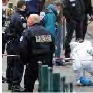
הפיגוע בבית הספר היהודי בטולח (20 במרץ 2012 http://www.israel-infos.net )

■ נסיבות הירי זוהות היורה אינם ברורים עדיין. חוקרים ואנשי ביטחון רבים מנהלים מצוד אחר הרוצח. קיימים כמה כיווני חקירה. בין השאר נבדקת האפשרות ששלושה חיילים, שסולקו מהצבא על רקע פעילות ניאו נאצית, קשורים לפיגוע כמו גם לפיגועים קודמים בהם נרצחו חיילים מיחדתם. בתגובה למתקפת הירי נגד בית הספר תאר נשיא צרפת סרקוזי את האירוע כ"טרגדיה לאומית" והורה על דקת דומיה בכל בתי הספר בצרפת. בכירים נוספים במערכת הפוליטית הצרפתית, משמאל ומימין, גינו אף הם את התקיפה.