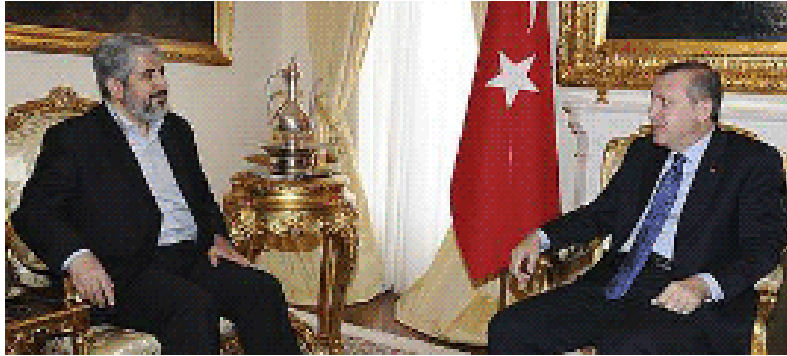
פגישת ח'אלד משעל וארדואן (20 במרץ 2012, palinfo.com)

עבדאללה גול ושר החוץ התורכי. במהלך הפגישה עם ארדואן הודה ח'אלד משעל על תמיכת תורכיה בעם הפלסטיני בדגש על המאמצים שהיא עושה להסרת "המצור מהרצועה" ועל מתן החסות למשוחררי עסקת שליט. ארדואן מצידו גינה את "התוקפנות הישראלית" על עזה וקרא לקדם את הדיאלוג הפנים-פלסטיני. ארדואן הדגיש, כי תורכיה תמשיך לתמוך במאמצים להשגת הכרה בינלאומית במדינה פלסטינית (אתר נשיאות תורכיה, סוכנות הידיעות התורכית, 17 במרץ 2012).