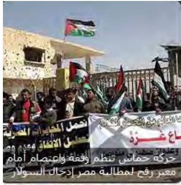
הפגנה ברצועת עזה בדרישה לחידוש אספקת הדלק ( http://www.palinfo.com , 20 במרץ 2012)

■ לגבי חידוש העברת הדלק קיימת מלחמת גרסאות תעמולתית בין מצרים לבין ממשל חמאס. מחמד עסקול מזכ"ל ממשל חמאס טען, כי המודיעין המצרי הוא שמערים קשיים בפני אספקת הדלק. לדבריו גם לאחר שרשות האנרגיה של ממשל חמאס העבירה סכום של שני מיליון דולרים לא הועבר להם הדלק לרצועה. המודיעין המצרי טען, שהודיע לממשל חמאס, כי יעביר את הציוד הנחוץ להעברת הדלק דרך מעבר כרם שלום, אולם חמאס מתנגדת לכך מסיבות פוליטיות, טכניות ומנהלתיות (פלסטין און לין, 18 במרץ 2012).