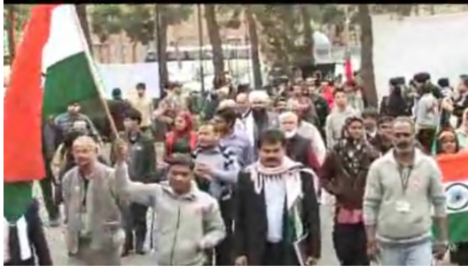
חברי השיירה האסיאתית צועדים ברחובות טהראן 19 במרץ 2012

■ לגבי האירוע בלבנון מדיווחים מעדכנים עולה, כי טרם נקבעו נקודות ההתכנסות בדרום לבנון אך הוזכרו נקודות המרוחקות מגדר הגבול עם ישראל המאפשרות את הכלת האירועים. במסגרת זאת הוזכרו בופור, אלח'יאם, ארנון או בנת ג'ביל (טלוויזיה פלסטינית, 19 במרץ 2012). אירועים מקבילים אמורים להיות בירדן, יהודה שומרון ורצועת עזה ואפשר גם סוריה. ברחבי העולם יתקיימו עצרות והפגנות, חלקן מול שגרירויות ישראל.