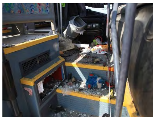
אוטובוס התלמידים שנפגע מירי טיל נ"ט, שנורה ע"י חמאס (באדיבות NRG 7 באפריל 2011. צלם: אדי ישראל)