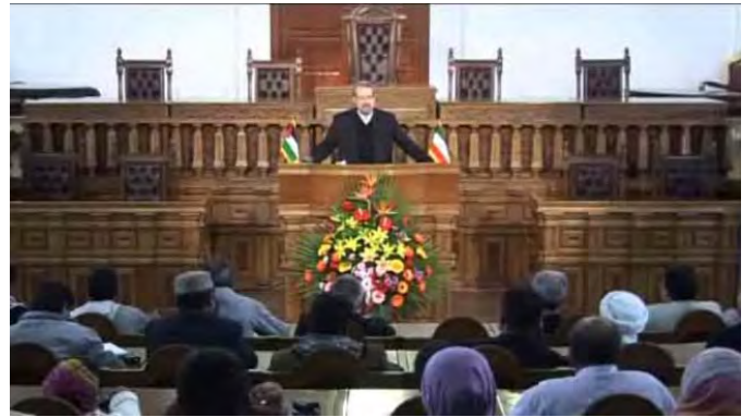
פעילי השיירה האסיאתית באיראן. מימין: בפגישה עם עלי לרגי'אני. משמאל: בפגישה עם עלי אכבר וילאתי (19 במרץ 2012 http://www.islamicinvitationturkey.com )

■ לדברי ט'היר אחמד צדיקי, נציג הודו בשיירה, בכל מקום בו עברה השיירה ברחבי איראן הצטרפו אליה משתתפים נוספים. לדבריו השיירה אמורה לצאת מאיראן לתורכיה שם תסייר באנקרה ובאיסטנבול ותצרף אליה משתתפים נוספים ומשם להגיע בדרך הים לביירות (אלעאלם, 19 במרץ 2012).