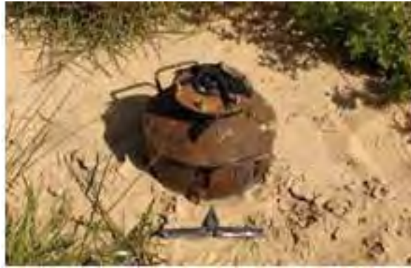
המטען, שנחשף ונוטרל במרכז רצועת עזה (דובר צה"ל, 26 במרץ 2012)