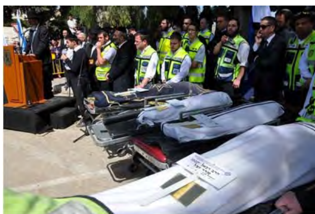
הלוויות ארבעת הנרצחים בפיגוע בטלוח, שהתקיימה בירושלים (באדיבות זק"א. צלם: שוקי לרר 22 במרץ 2012)