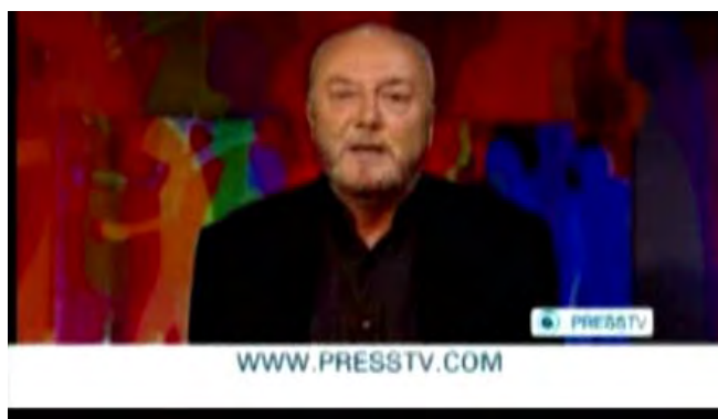
George Galloway sur une vidéo de Press TV, dans le cadre de la campagne de propagande des marches

7) La chaîne de télévision iranienne en langue anglaise Press TV a également été enrôlée pour promouvoir une campagne de propagande pour les marches. Le 8 janvier 2012, une vidéo a été publiée sur YouTube pour promouvoir les marches, produite par Press TV et présentant George Galloway donnant sa bénédiction aux marches, qui, selon ses termes "promouvront le retour des Palestiniens à ce qu'ils [les Israéliens] appellent Israël". Press TV a également diffusé une conférence téléphonique entre George Galloway et l'activiste indien anti-israélien pro-palestinien Feroze Mithiborwala, l'organisateur du convoi asiatique (YouTube). De plus, une page Facebook a été ouverte en Farsi pour la Marche mondiale sur Jérusalem (Facebook.com/Farsi).