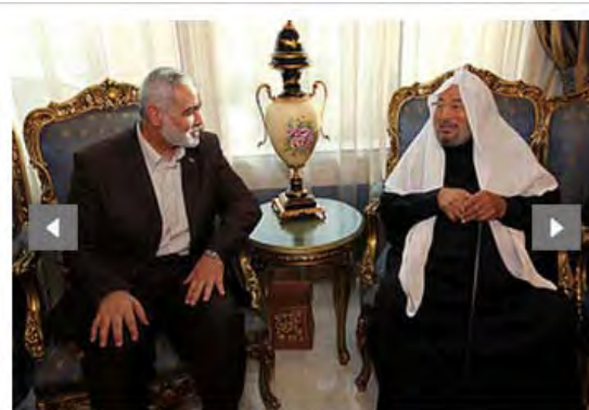
Исмаил Хания и Юсуф аль-Кардауи в Катаре.

■ 4 февраля делегация выехала из Катара в Бахрейн , где встретилась с королем Бахрейна Хамадом ибн-Исса Ааль Халифа. Они обсудили проблему Иерусалима, так называемую «блокаду» сектора Газы и экономическую ситуацию в секторе Газы (новостное агентство Safa , 5 февраля 2012). Хания встретился также с председателем парламента Бахрейна (новостное агентство Бахрейна, 5 февраля 2012).