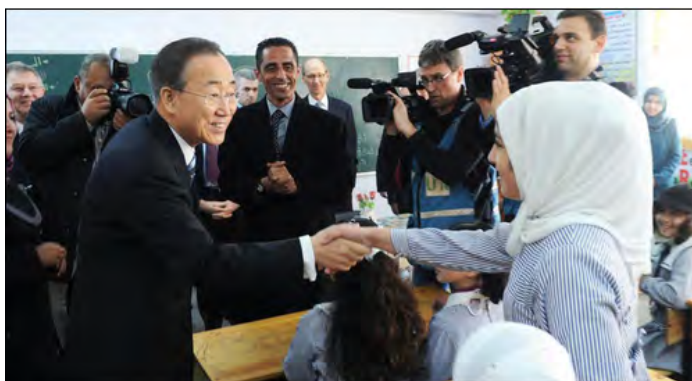
Пан Ги Мун посещает школу UNRWA в секторе Газы (фото с. Сархана, вебсайт ООН, 2 февраля 2012).

содержатся в Израиле, и сказал, что министр по делам заключенных в Палестинской автономии передал ему письмо на эту тему (вебсайт ООН, 2 февраля 2012).