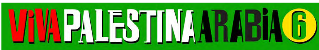
Лого Вива Палестина Арабия (вебсайт Viva Palestina , 6 февраля 2012)

■ Организаторы конвоя набирают волонтеров для участия и ищут доноров, которые дадут денег на покупку транспортных средств. Волонтеры должны быть старше 23 лет, иметь водительские права в течение по меньшей мере пяти лет, а также международные водительские права. Кроме того, в их паспортах не должно быть израильских отметок.