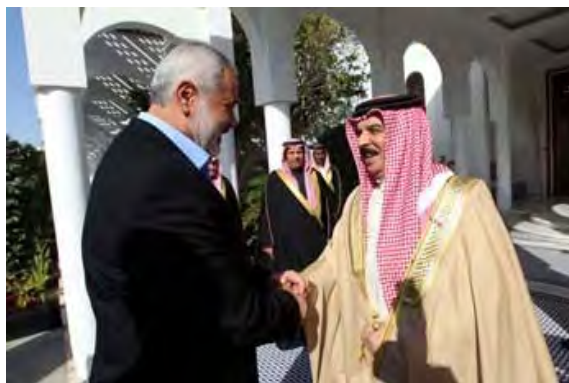
Исмаил Хания и король Бахрейна (хамасовский вебсайт Palestine-info , 5 февраля 2012).

■ 4 февраля делегация выехала из Катара в Бахрейн , где встретилась с королем Бахрейна Хамадом ибн-Исса Ааль Халифа. Они обсудили проблему Иерусалима, так называемую «блокаду» сектора Газы и экономическую ситуацию в секторе Газы (новостное агентство Safa , 5 февраля 2012). Хания встретился также с председателем парламента Бахрейна (новостное агентство Бахрейна, 5 февраля 2012).