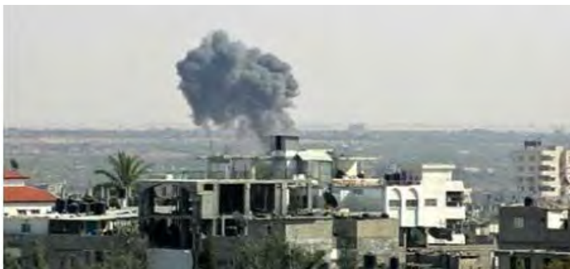
Атака израильских ВВС в районе Рафияха (вебсайт Бригад Азз ад-Дин аль-Кассам, 21 января 2012).