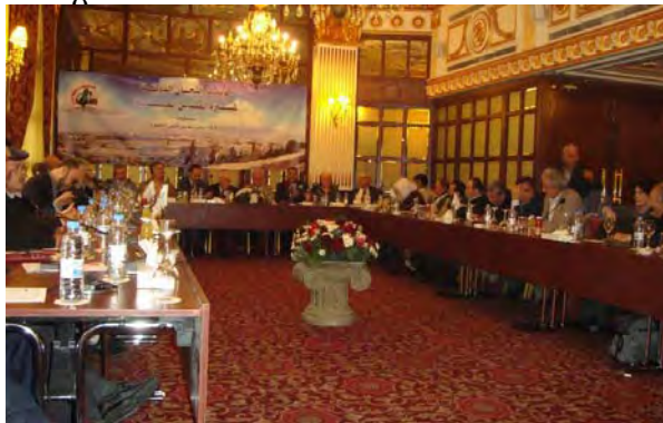
Слева: Мустафа Баргути на встрече в Бейруте (вебсайт GM2J , 24 января 2012). Справа: встреча в Бейруте (страница GMJ в Facebook , 22 января 2012).