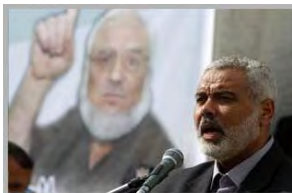
Исмаил Хания, глава фактической администрации ХАМАСа в секторе Газы, на фоне портрета Азиза Дуейка (вебсайт Бригад Азз ад-Дин аль-Кассам, 21 января 2012)