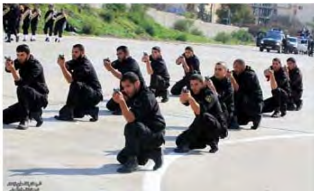
Силы безопасности ХАМАСа на учениях (хамасовский вебсайт Palestine-info , 19 января 2012)

■ По сообщениям саудовской газеты Аль-Шарк , во время своего визита в Египет Исмаил Хания встретился с главой египетской разведки. Оба пришли к согласию относительно того, что силы безопасности ХАМАСа будут более тщательно инспектировать туннели, особенно в том, что касается контрабанды оружия из сектора Газы в Синай, проникновения разыскиваемых египтян в сектор Газы и контрабанды угнанных в Египте транспортных средств. В свою очередь египетский режим обещал облегчить условия на пропускном пункте Рафиах и увеличить число палестинцев, которые могут пользоваться им, а также увеличить количество часов работы пропускного пункта и изучить вопрос экспорта товаров из Газы через него ( Al-Sharq , 23 января 2012).