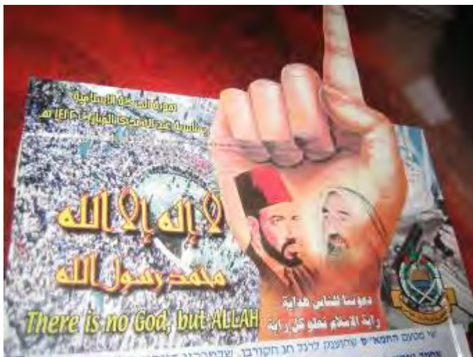
Cadeau du Hamas pour l'Eid Al-Adha, dans le cadre de ses activités de da'wah. A droite, portraits de Hassan al-Banna et d'Ahmed Yassin. L'emblème du Hamas est en bas à droite.

5. Le régime de Hosni Moubarak était sérieusement concerné par les liens entre les Frères Musulmans et le Hamas. Il était également concerné par la prise de contrôle militaire du Hamas de la bande de Gaza (appelée "Emirat Islamique" par les médias égyptiens), sa réhabilitation militaire (via la contrebande d'armes dans la bande de Gaza par l'Egypte) et l'islamisation de la bande de Gaza . Le régime avait peur que la bande de Gaza exporte le terrorisme, la subversion et l'Islam extrémiste en Egypte, qui serait un danger pour la sécurité nationale de l'Egypte . En conséquence, le régime égyptien a cherché à limiter les liens entre les Frères Musulmans et le Hamas autant que possible. Selon nous, après l'ostracisme de Moubarak, les Frères Musulmans devraient tenter de modifier cette politique .