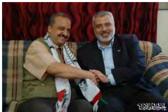
Ismail Haniya, le chef de l'administration de facto du Hamas dans la bande de Gaza aux côtés du Dr. Muhammad al-Baltagi, le secrétaire général de la faction des Frères Musulmans à l'Assemblée Populaire égyptienne. Al-Baltagi a mené la délégation égyptienne à bord du Mavi Marmara.