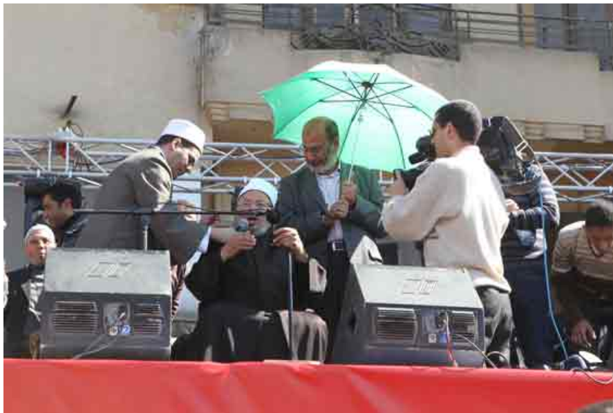
Cheikh al-Qardawi à un rassemblement place Tahrir au Caire. Dans son discours, il a appelé à la libération de la mosquée Al-Aqsa et a demandé à l'armée égyptienne d'ouvrir le terminal de Rafah.

Le Hamas essaie de profiter des événements en Egypte et de ses liens avec les Frères Musulmans pour améliorer son image vis-à-vis du gouvernement égyptien et faciliter la contrebande d'armes dans la bande de Gaza. À cette fin, le Hamas a invité al-Qardawi, l'autorité religieuse du Hamas, à se rendre à Gaza.