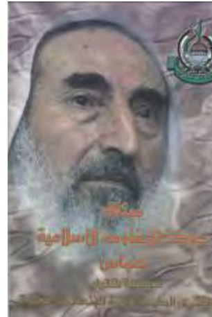
Ahmed Yassin, le fondateur du Hamas, en couverture de la charte du mouvement imprimée à Qalqilya en 2004

Citation attribuée à "l'imam et chahid Hassan al-Banna" en page trois de la charte du Hamas : "Israël se lèvera et continuera à exister jusqu'à ce que l'Islam l'anéantisse, comme il a anéanti ce qui l'a précédé"