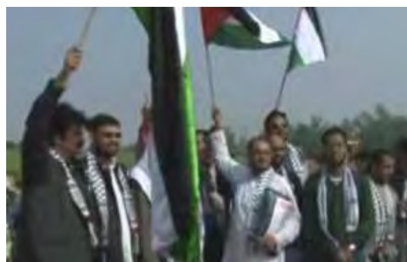
Départ du convoi (PressTV, Iran, 2 décembre 2010)

■ La flotte Freedom 2 : Selon des reportages dans les médias arabes, la flottille organisée par la coalition anti-israélienne devrait prendre la mer en Avril 2011, avec 34 bateaux (Al-Quds, 2 décembre 2010).