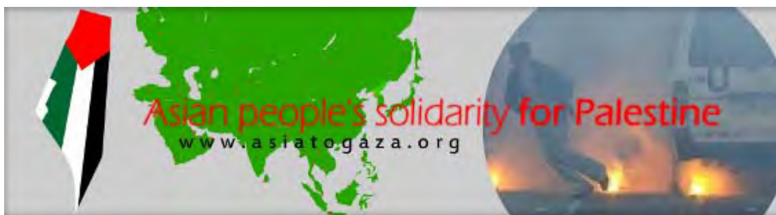
Logo d'APSP montrant tout l'Etat d'Israël recouvert du drapeau palestinien, expression de l'établissement d'un Etat palestiniens sur toutes les terres de "Palestine", éradiquant ainsi Israël de la carte (Site Internet du convoi, 6 décembre 2010)