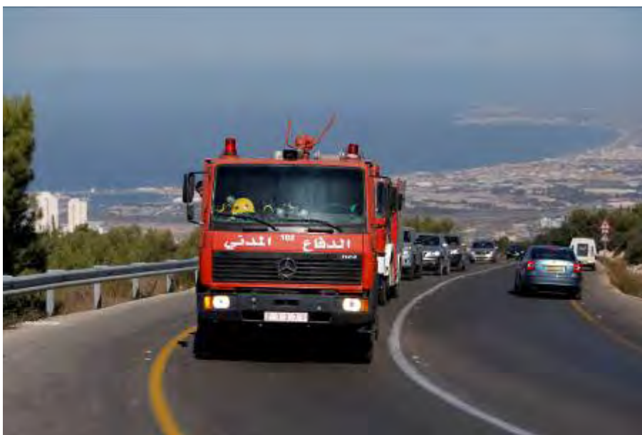
Camion de lutte contre l'incendie de l'Autorité Palestinienne se rendant vers le Mt. Carmel pour aider à combattre le feu forestier (5 décembre 2010). Les porte-parole du Hamas se sont déclarés satisfaits de l'incendie, le qualifiant d'instrument aux mains d'Allah contre Israël.