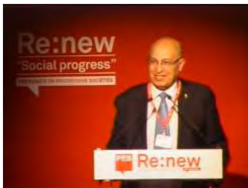
Nabil Shaath à la conférence du PES à Berlin (Site Internet du PES, 6 novembre 2010)