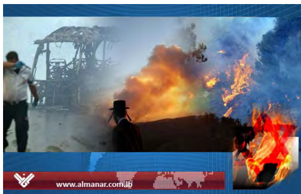
Couverture Internet de la chaîne Al-Manar montrant un pompier épuisé, des flammes et les restes du bus incendié. Au premier plan en bas à gauche, une étoile de David en flammes (Al-Manar, 3 décembre 2010)