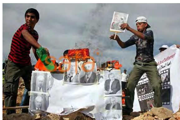
Gauche : Palestiniens tenant une affiche protestant contre la Déclaration Balfour (Agence de presse Safa, 6 novembre 2010). Droite : Adolescents palestiniens brûlant des photos de dirigeants israéliens durant une manifestation près de la localité israélienne de Karmeï Tzur (Agence de presse Safa, 6 novembre 2010)