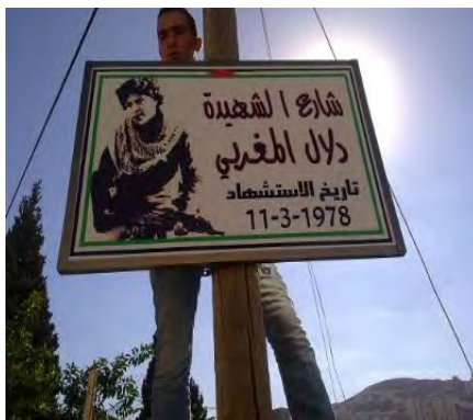
Nomination d'un rue de Naplouse en mémoire de Dalal Magribi (Al-Quds, 3 novembre 2010)

■ En Mars 2010, une cérémonie officielle de l'Autorité Palestinienne devait avoir lieu pour la nomination de la place Dalal al-Magribi dans la ville d'Al-Bireh près des bureaux du conseil politique de l'AP. Peu avant la cérémonie, les Palestiniens ont annoncé qu'il avait été décidé de ne pas l'organiser "pour des raisons techniques". La municipalité d'Al-Bireh a annoncé que l'annulation était liée à la pression exercée par Israël sur l'AP (Reuters, 10 mars 2010). Finalement, l'AP a permis la tenue de la cérémonie, mais sans caractère officiel. La commémoration a finalement été organisée par le Fatah avec la participation d'un responsable du mouvement. 3