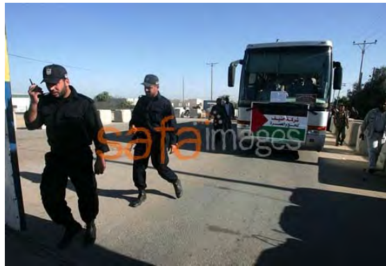
Bus transportant des pèlerins palestiniens de la bande de Gaza se rendant à La Mecque via le terminal de Rafah (3 novembre 2010)