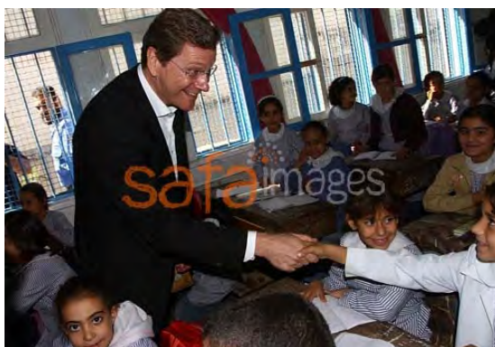
Le ministre allemand des Affaires étrangères Guido Westerwelle visite une école de l'UNRWA dans la bande de Gaza (Agence de presse Safa, 8 novembre 2010)