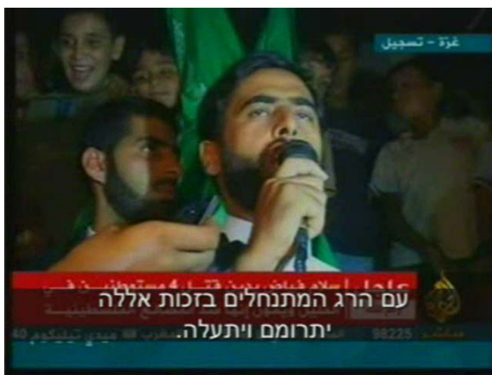
Le porte-parole du Hamas Musheir al-Masri salue la fusillade terroriste en Judée-Samarie (Al-Jazeera, 31 août 2010)