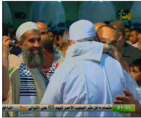
La délégation algérienne accueillie dans la bande de Gaza (Télévision Al-Aqsa du Hamas, 4 septembre 2010)

o Turquie : Le 13 août, une délégation turque de 45 membres est arrivée dans la bande de Gaza, dont neuf membres de l'IHH blessés dans la confrontation à bord du Mavi Marmara. La délégation a été reçue par le responsable de l'administration de facto du Hamas Ismail Haniya, des ministres du Hamas et des députés du Conseil Législatif Palestinien.