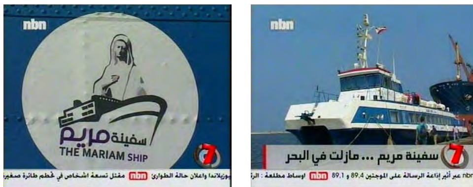
Le Mariam mouillant dans le port de Tripoli et son insigne (NBN-TV, 4 septembre 2010)