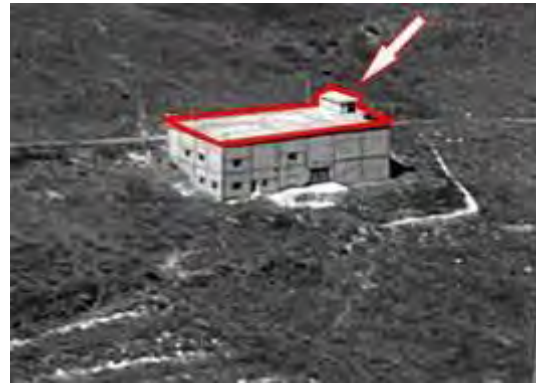
Bâtiment à la périphérie du village de Khirbet Silim qui servait de dépôt d'armes au Hezbollah, avant (à gauche) et après l'explosion