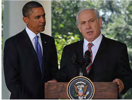
Le Premier ministre israélien Benjamin Netanyahu et le Président américain Barack Obama avant le dîner de travail (Bureau de presse du gouvernement israélien, 1er septembre 2010)

■ Dans son discours du 2 septembre, le Président de l'Autorité Palestinienne Mahmoud Abbas a déclaré que les pourparlers ne devaient pas reprendre à zéro mais être fondés sur les épisodes précédents dans lesquels toutes les questions non résolues avaient été définies. Il a ajouté que pendant les pourparlers de l'année à venir, les côtés traiteront de toutes les questions de l'accord du statut final, y compris Jérusalem, les implantations, les frontières, la sécurité, l'eau et la libération des prisonniers afin "d'atteindre une paix qui mettra fin au conflit" (Haaretz, 3 septembre 2010).