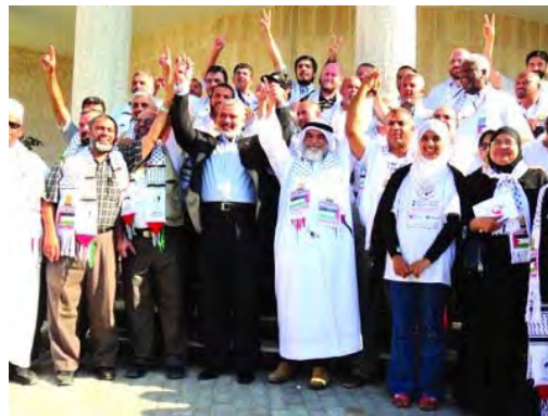
Membres de la délégation turque avec Ismail Haniya (YeniSafak.com.tr, 13 août 2010)

o Turquie : Le 13 août, une délégation turque de 45 membres est arrivée dans la bande de Gaza, dont neuf membres de l'IHH blessés dans la confrontation à bord du Mavi Marmara. La délégation a été reçue par le responsable de l'administration de facto du Hamas Ismail Haniya, des ministres du Hamas et des députés du Conseil Législatif Palestinien.