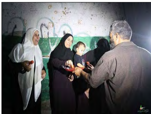
Distribution de bonbons dans le camp de réfugiés de Jabaliya pour célébrer l'attaque terroriste (Site Internet du Hamas Palestine-info, 31 août 2010)