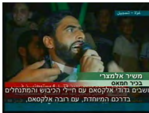
Musheir al-Masri salue la fusillade qui a fait quatre morts israéliens (Al-Jazeera, 31 août 2010)

■ Le Hezbollah a également salué l'attaque. L'organisation a déclaré dans un communiqué qu'elle était "un message clair qui prouve qu'il n'y a aucune autre option que la résistance" (cf., le terrorisme et la violence). Elle a ajouté que l'attaque était une réponse à la "politique d'occupation et d'implantation" et que "les colons peuvent être considérés comme des soldats