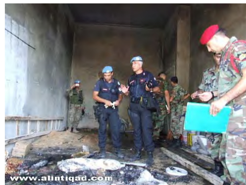
Forces de la Finul examinant l'intérieur et l'extérieur du site de l'explosion