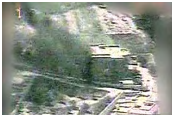
Photographie aérienne du bâtiment où les explosions se sont produites

■ Après l'explosion, le Hezbollah a empêché les soldats de la Finul et de l'armée libanaise ainsi que la presse de s'approcher du secteur. Utilisant des camions et d'autres véhicules, les membres de l'organisation ont procédé au retrait clandestin des armes restantes dans le dépôt, et les ont déplacées vers les villages voisins. Les forces de l'armée libanaise sont ensuite entrées dans le secteur pour enquêter. Les forces de la Finul ont observé de loin et ont photographié le secteur depuis un hélicoptère (Pour voir les photographies du site et le déplacement des armes restantes, voir la vidéo prise par un drone de Tsahal et publiée par le porte-parole de l'armée, attachée à ce bulletin).