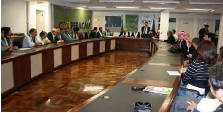
Délégation du Brésil à la Campagne européenne contre le siège de Gaza