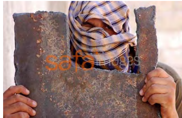
Un contrebandier palestinien brandit des morceaux de la barrière d'acier souterraine (Agence de presse, 26 août 2010)