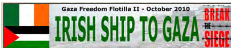
Logo du navire irlandais pour Gaza (Site Internet Ireland-Palestine Solidarity Campaign, 31 août 2010)