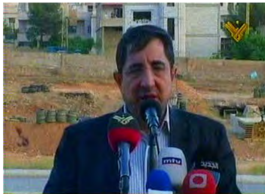
Le ministre libanais de l'Agriculture. Sa présence à l'exercice témoigne de la légitimité accordée par le gouvernement libanais aux activités du Hezbollah (Al-Manar, 24 mai 2010)