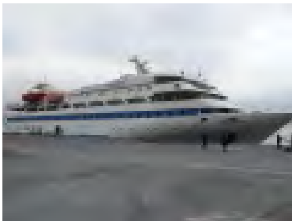
Le Mavi Marmaris, un des navires de la flotte, au départ d'Istanbul pour Gaza le 22 mai (Site Internet IHH, 23 mai 2010)