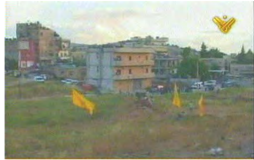
Photos de l'exercice militaire du Hezbollah à Baalbek (Al-Manar, 24 mai 2010)