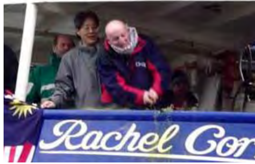
Départ du Rachel Corrie dans le port irlandais de Dundalk (Site Internet du Hamas Palestine-info, 15 mai 2010)

■ Les bateaux et les passagers : Au moins neuf bateaux devraient atteindre Gaza, transportant entre 800 et 1000 passagers de 40 pays. Le bateau turc transporte 600 passagers (la plupart devaient embarquer à Antalya). Ils comprennent des membres de différents Parlements, des activistes des droits de l'Homme et des journalistes, etc... Un groupe d'Arabes israéliens devrait les rejoindre, dont cheik Ra'ed Salah, le chef de la faction septentrionale du Mouvement Islamique (Agence de presse Ma'an, site Internet IHH, 20 mai 2010).