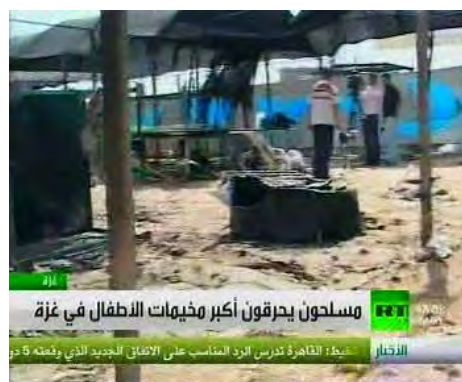
Le camp après l'incendie (Russia Today, 23 mai 2010)