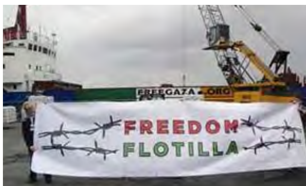
Poster de la "Flotte de la Liberté" (Site Internet du Hamas Palestine-info, 15 mai 2010)