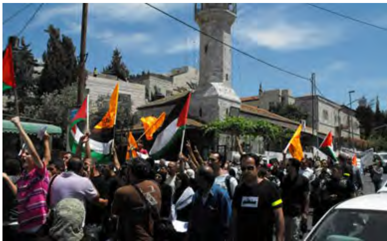
Défilé à l'occasion de la Journée de la Nakba dans le quartier de cheikh Jarrah à Jérusalem (Agence de presse Safa, 15 mai 2010)