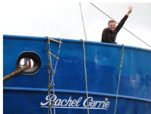
Départ du Rachel Corrie (Palestine Telegraph, 10 mai 2010)