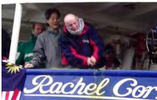
Inauguration du Rachel Corrie (Site Internet du Hamas Palestine-info, 15 mai 2010)